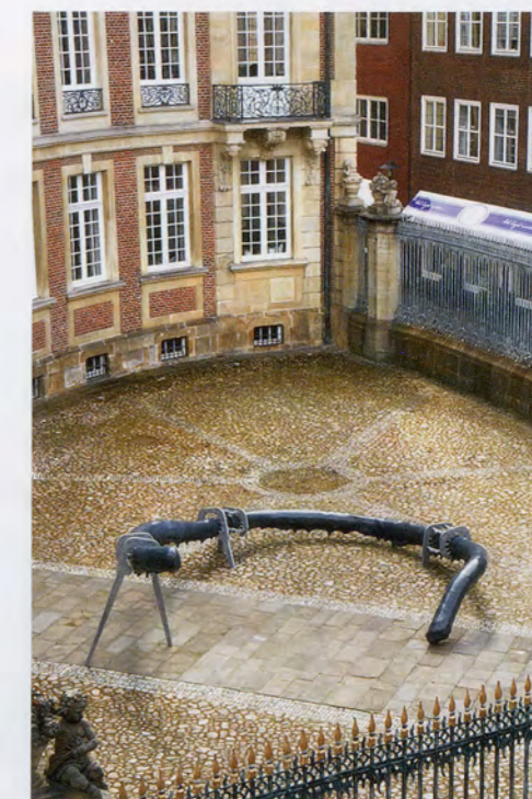
NAIRY BAGHRAMIAN, PRIVILEGED POINTS , 2017, 2 parts, bronze, lacquer, zinked steel, rubber, back yard: approx. 59 x 236 1/4 x 157 1/2", installation view, Skulptur Projekte Münster, 2017 / BEVORZUGTE STELLEN, 2 Teile, Bronze, Lack, verzinkter Stahl, Gummi, Hinterhof: ca. 150 x 600 x 400 cm, Installationsansicht.

CAOIMHÍN MAC GIOLLA LÉITH ist Kritiker und Kurator. Er unterrichtet am University College Dublin, Irland.