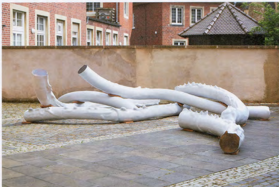
NAIRY BAGHRAMIAN, PRIVILEGED POINTS , 2017, 2 parts, bronze, lacquer, zinked steel, rubber, front yard: approx. 78 3/4 x 275 1/2 x 197", installation view, Skulptur Projekte Münster, 2017 / BEVORZUGTE STELLEN, 2 Teile, Bronze, Lack, verzinkter Stahl, Gummi, Vorplatz: ca. 200 x 700 x 500 cm, Installationsansicht.

in Athens, she installed DRAWING TABLE (HOMAGE TO JANE BOWLES) (2017), a sculpture that revisited a work made fifteen years before, IRON TABLE (HOMAGE TO JANE BOWLES) (2002), before traveling on to Kassel to install the earlier work there.