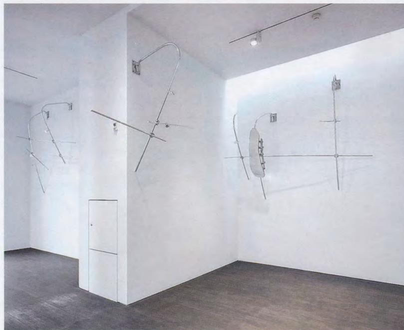
NAIRY BAGHRAMIAN, SCRUFF OF THE NECK (STOPGAP), 2016, cast and polished aluminum, polished aluminum rods, polished aluminum components, 86 3/8 x 110 1/4 x 42 1/8", installation view, S.M.A.K., Gent, 2016 / GENICK (LÜCKENBÜSSER), gegossenes und poliertes Aluminium, polierte Aluminiumstäbe, polierte Aluminiumbestandteile, 220 x 280 x 107 cm, Installationsansicht.