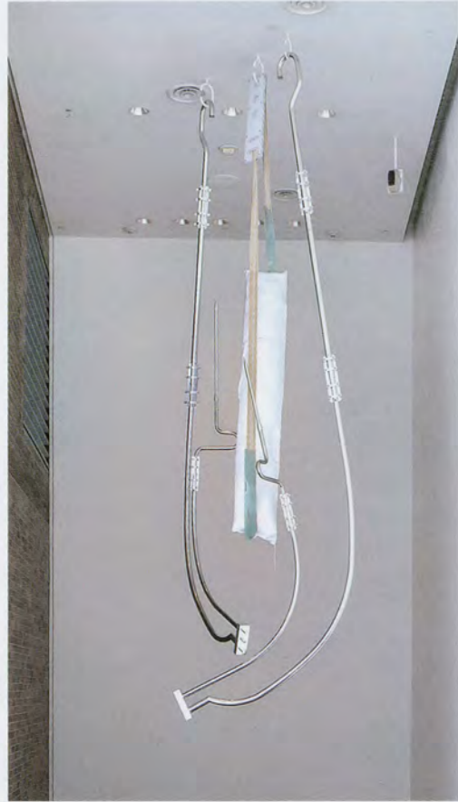
Nairy Baghramian, HEADGEAR , 2016, polished stainless steel, polished aluminum, fabric, silicone, rubber, polyurethane foam, polycarbonate, approx. 275 1/2 x 196 7/8 x 59", installation view, Walker Art Center, Minneapolis, 2017 / KOPFGESTELL , polierter rostfreier Stahl, poliertes Aluminium, Textil, Gummi, Polyurethanschaum, Polycarbonat, ca. 700 x 500 x 150 cm.