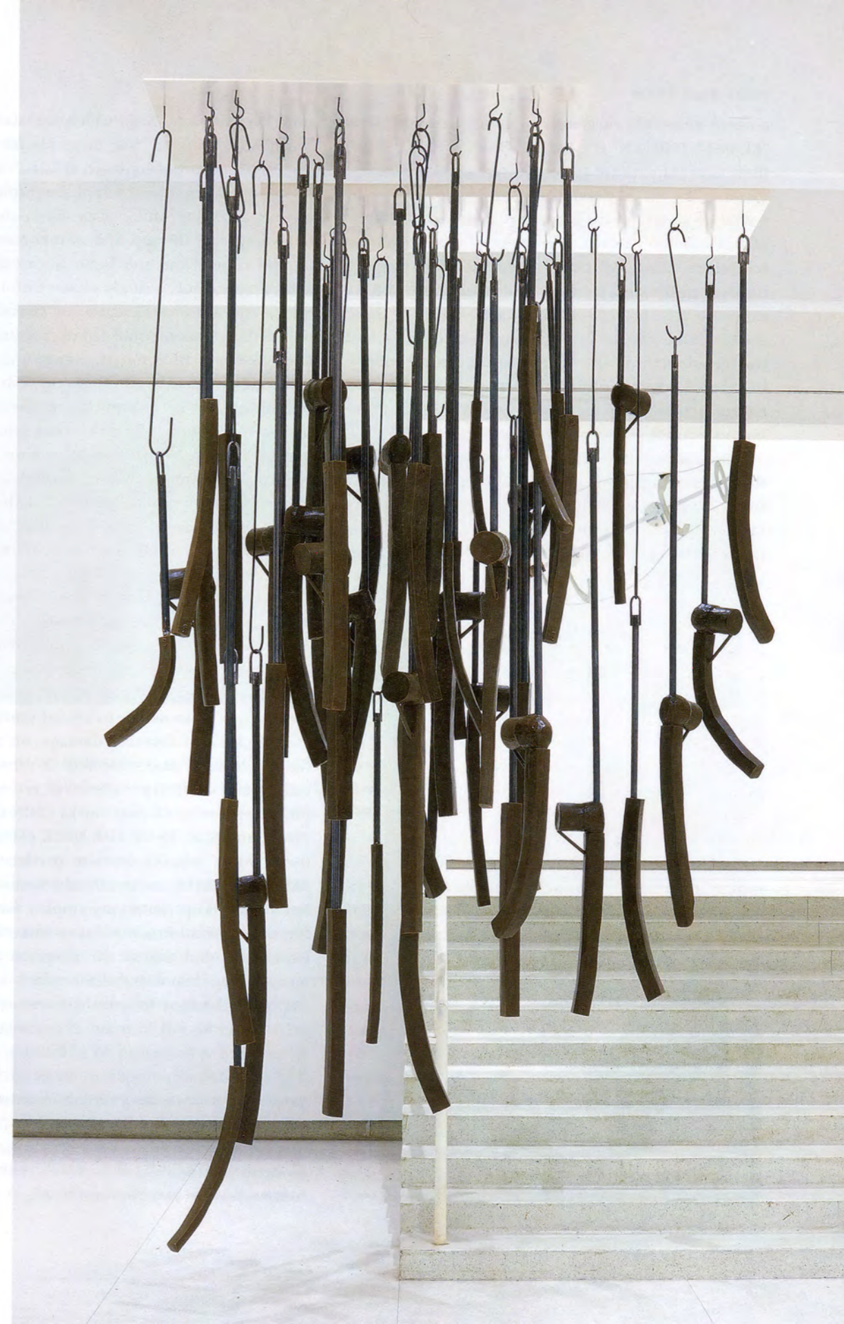
NAIRY BAGHRAMIAN, JUPON SUSPENDU, 2017, wax, steel, lacquered aluminum, installation view, Walker Art Center, Minneapolis, 2017 / Wachs, Stahl, lackiertes Aluminium, Installationsansicht.

A second group of sculptures, the series “SITZEN-GEBLIEBENE” (STAY DOWNERS), also spread over several exhibition spaces. Generally bulbous in form, and mostly made of polyurethane foam in a range of candy colors, their comical demeanor is amplified by their infantilizing monikers: BABBLER, DRIPPER, SHILLY-SHALLY, FIDGETY PHILIP, GRUBBY URCHIN, CLASS CLOWN. These descendants of a more darkly