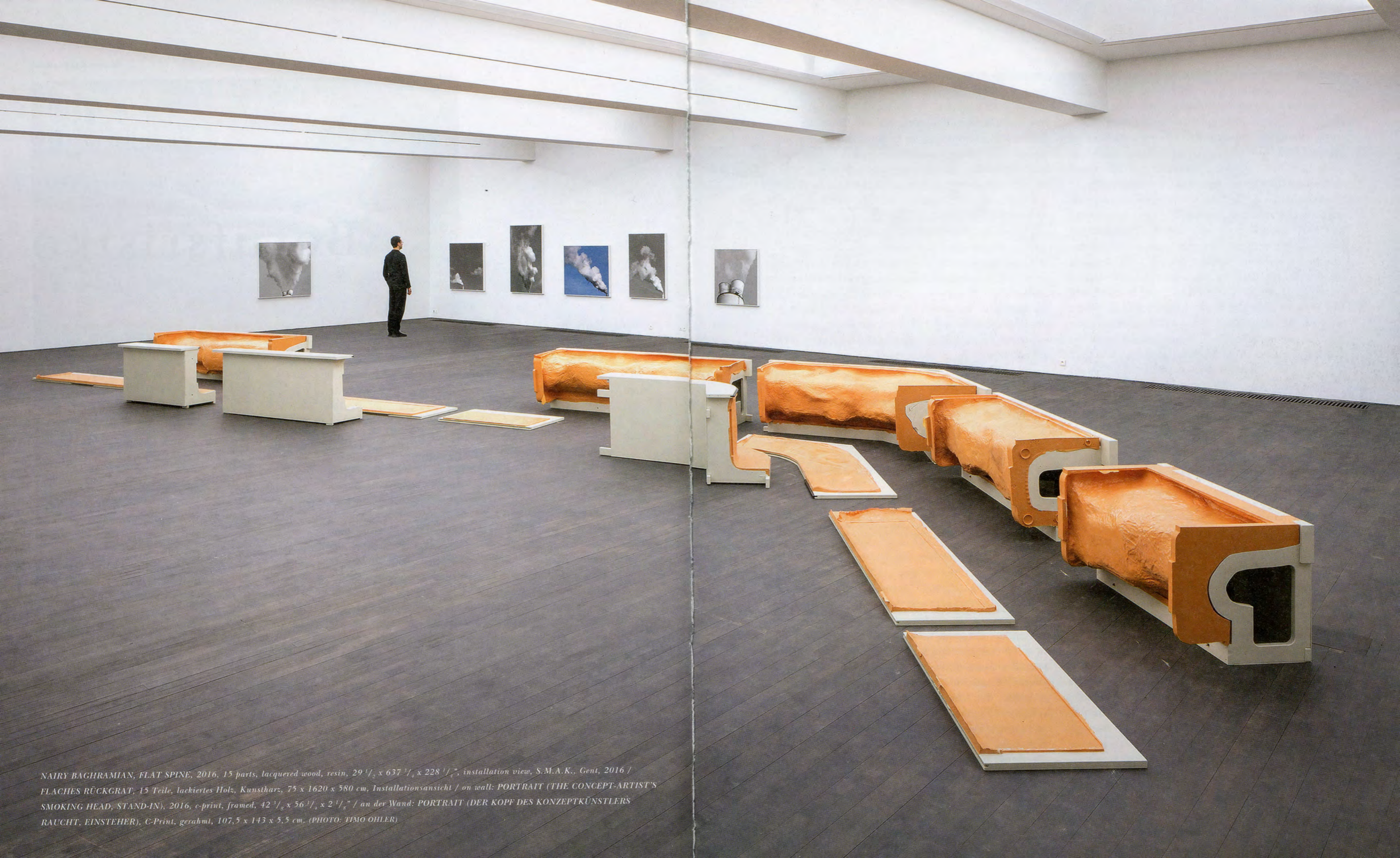
NAIRY BAGHRAMIAN, FLAT SPINE , 2016, 15 parts, lacquered wood, resin, 29 1/2 x 637 3/4 x 228 1/4", installation view, S.M.A.K., Gent, 2016 / FLACHES RÜCKGRAT , 15 Teile, lackiertes Holz, Kunstharz, 75 x 1620 x 580 cm, Installationsansicht / on wall: PORTRAIT (THE CONCEPT-ARTIST'S SMOKING HEAD, STAND-IN) , 2016, c-print, framed, 42 3/8 x 56 1/4 x 2 1/8" / an der Wand: PORTRAIT (DER KOPF DES KONZEPTKÜNSTLERS RAUCHT, EINSTEHER) , C-Print, gerahmt, 107,5 x 143 x 5,5 cm.