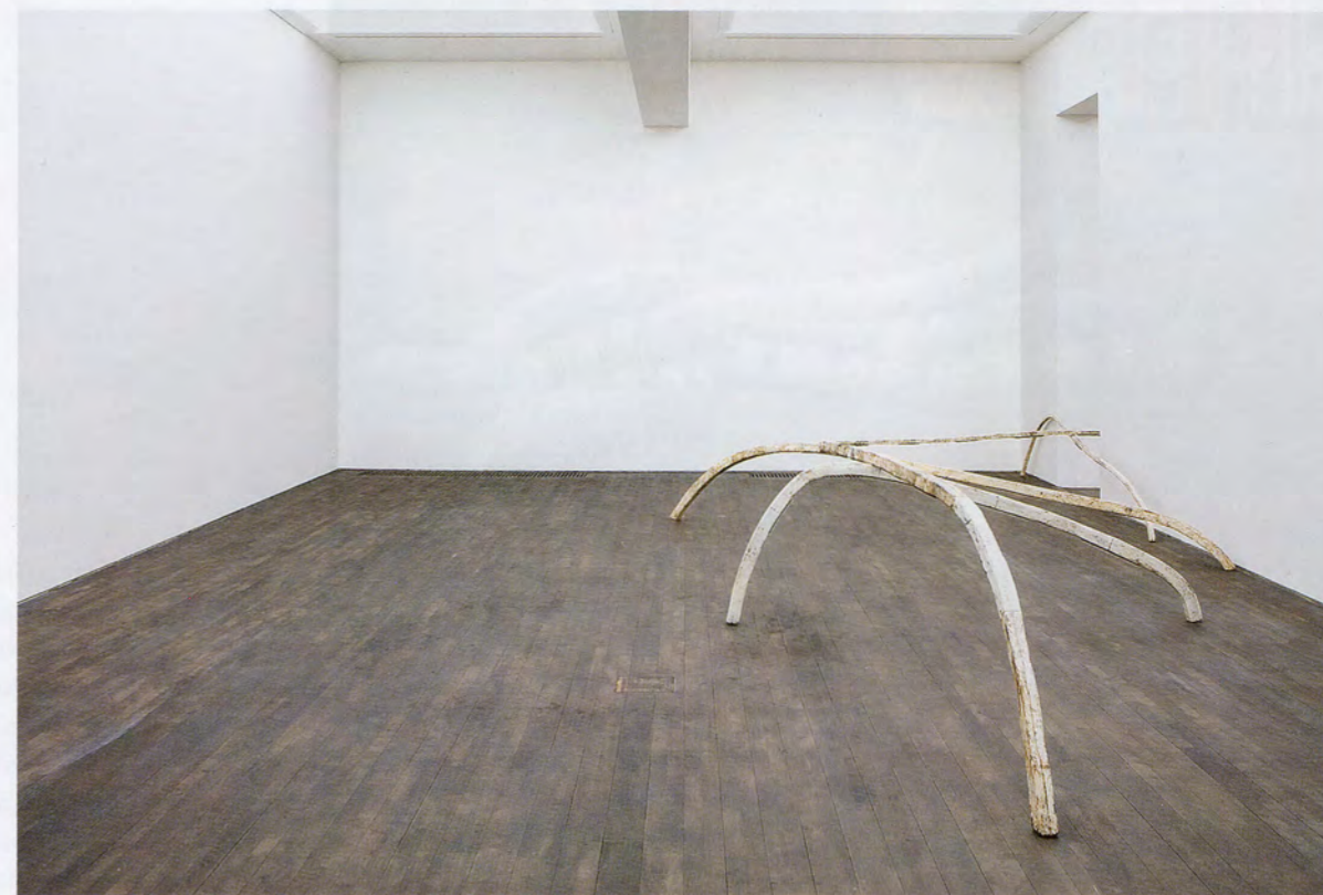
NAIRY BAGHRAMIAN, JUPON RÉASSEMBLÉ , 2016, epoxy resin, steel, wax, 39 3 / 8 x 363 x 187 3 / 4 ", installation view, S.M.A.K., Gent, 2016 / Epoxidharz, Stahl, Wachs , 100 x 922 x 477 cm, Installationsansicht.

This idea of forceful damage on a larger-than-life-size scale is also reflected in various sculptures redolent of medical prostheses or remedial dentistry, including the multi-part works CHIN-UP (FIRST FITTING) and SCRUFF OF THE NECK (STOPGAP). While these works' equally oversize predecessors, such as RETAINER (2014), were already disconcerting, these latest, scaled-up mutations amplify further the conflicting associations of curative attention and sadistic torture that attend the disquieting sight of an array of needle-pointed devices in a dentist's office. At SMAK, the most physically commanding of these