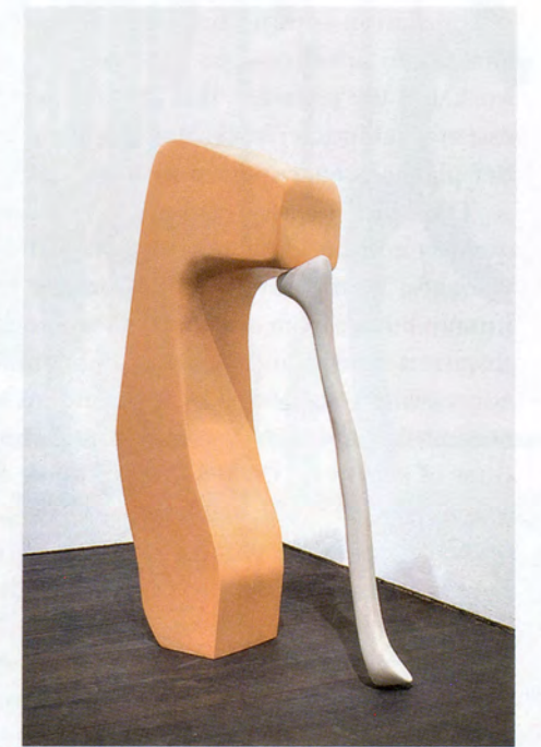
NAIRY BAGHRAMIAN, STAY DOWNERS (TRUANT), 2016, polyurethane, 56 3/4 x 33 7/8 x 12 1/4", installation view, S.M.A.K., Gent, 2016 / SITZENGBLIEBENE (SCHWÄNZER), Polyurethan, 144 x 86 x 31 cm, Installationsansicht.

CAOIMHÍN MAC GIOLLA LÉITH is a critic and curator; he teaches at University College Dublin, Ireland