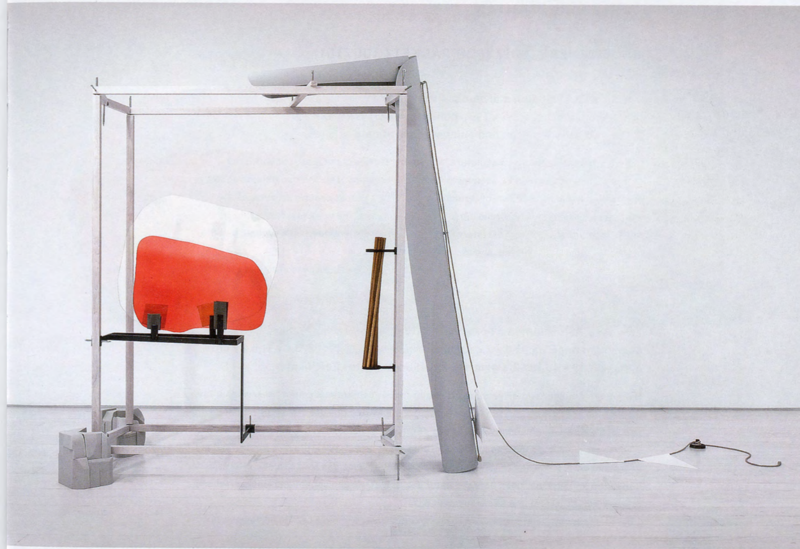
NAIRY BAGHRAMIAN, DRAWING TABLE (HOMAGE TO JANE BOWLES), 2017, waxed wood, lacquered aluminum, rope, painted canvas, mouth-blown glass, polyurethane, marble plaster, steel, stainless steel, wax, 114 1/8 x 240 1/8 x 51 1/8", installation view, EMST—National Museum of Contemporary Art, Athens, documenta 14, 2017 / ZEICHENTISCH (HOMMAGE AN JANE BOWLES), gewachstes Holz, lackiertes Aluminium, Seil, bemalte Leinwand, mundgeblasenes Glas, Polyurethan, Marmorgips, Stahl, Marmorputz, Stahl, rostfreier Stahl, Wachs, 290 x 610 x 130 cm.