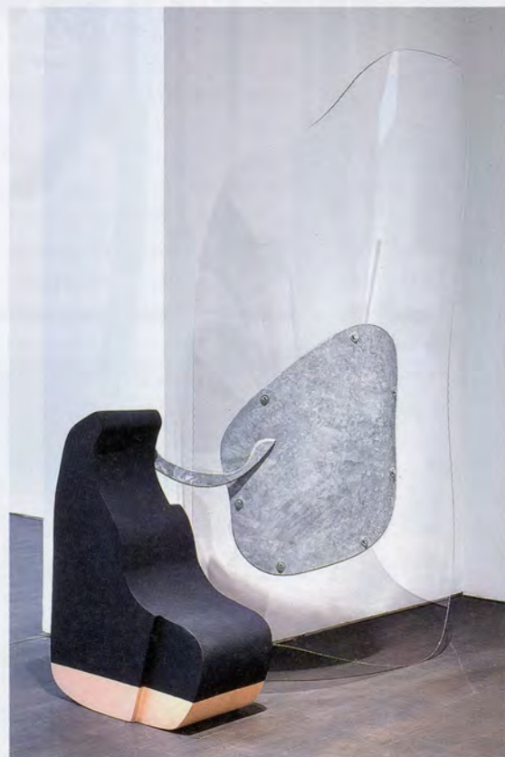
NAIRY BAGHRAMIAN, BIG VALVE , 2016, zinked metal, painted polyurethane, polycarbonate, 65 3 / 4 x 54 1 / 2 x 13 3 / 8 ", installation view, S.M.A.K., Gent, 2016 / GROSSES VENTIL , verzinktes Metall, bemaltes Polyurethan, Polycarbonat, 167 x 138 x 34 cm, Installationsansicht.

This space was shared with two more sizable, although fragmentary, works, PORTRAIT (DER KOPF DES KONZEPTKÜNSTLERS RAUCHT, EINSTEHER (THE CONCEPT-ARTIST'S SMOKING HEAD, STAND-IN) and FLAT SPINE. Punning on the German expres-