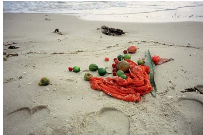
DOMINIQUE GONZALEZ-FOERSTER, BAHIA DESORIENTADA (REPÉRAGES), (Disoriented Bahia / Verwirrtes Bahia) 2004.