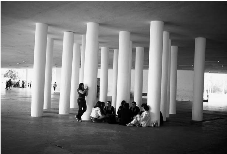
DOMINIQUE GONZALEZ-FOERSTER, DOUBLE TERRAIN DE JEU ( Double Playground / Doppelter Spielplatz ), 2006, installation view / Installationsansicht, Biennale de São Paulo.

So what are the works that made Gonzalez-Foerster well-known to the world? Asked to describe her open-air project for Documenta 11 in 2002, Gonzalez-Foerster enumerates some of the elements that were displayed amid the shadows cast from the large trees south of Kassel's Orangerie, and where one could see exhausted viewers dozing off on the lawn: "It's a park; it's a plan for escape; it's an extra-large piece of lava rock that's come from Mexico and landed on the green grass; it's a blue phone booth from Rio de Janeiro; it's a butterfly pavilion screening of a film inspired by The Invention of Morel , the fantastic novel by Adolfo Bioy Casares; it's a rose tree from Chandigarh; it is outside, coming from all over the world." 2 ) On hearing this list of seemingly unrelated parts—removed from their original contexts but arranged together in subtle tension—one senses that this is less a work exploring its medium than an atmospheric space that draws out the melancholy inherent in its pieces. If there is a medium, then it must be space itself.