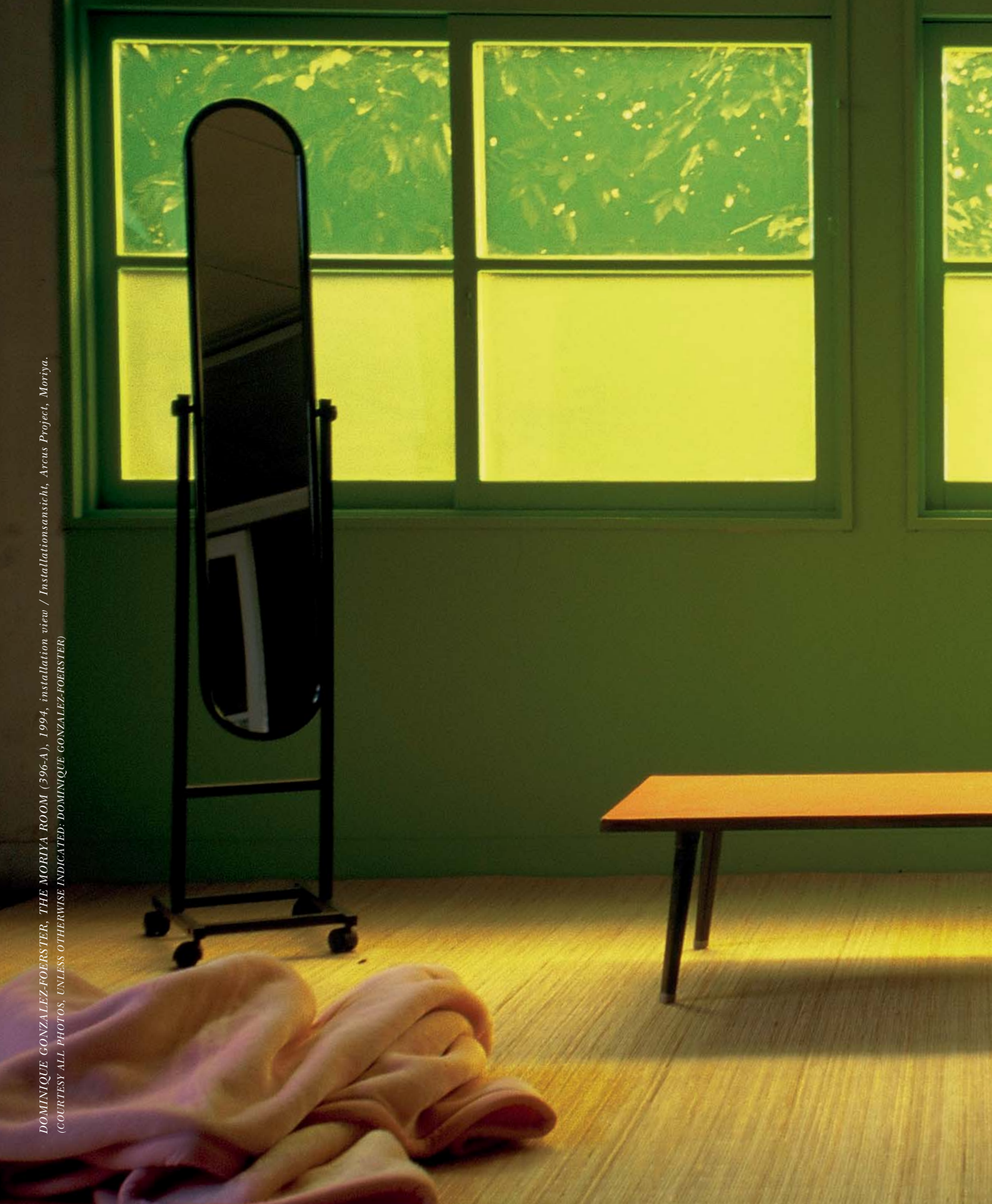
DOMINIQUE GONZALEZ-FOERSTER, THE MORIYA ROOM (396-A), 1994, installation view / Installationsansicht, Arcus Project, Moriya.