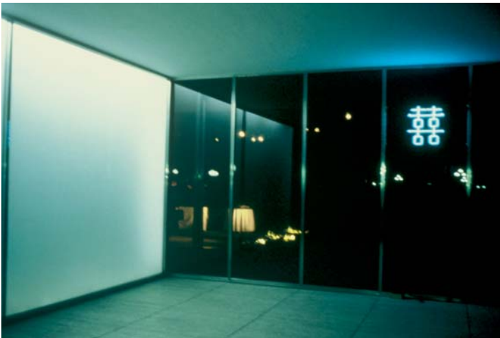
DOMINIQUE GONZALEZ-FOERSTER, TROPICALITÉ MODERNITÉ (DOUBLE HAPPINESS), 1999, with Jens Hoffmann, installation view / Installationsansicht, Mies van der Rohe pavilion, Barcelona.