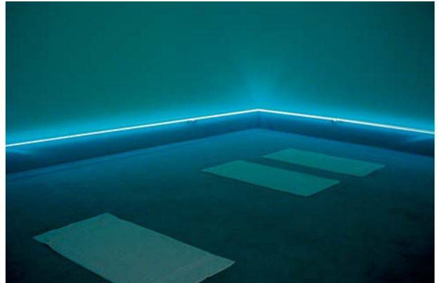
DOMINIQUE GONZALEZ-FOERSTER, RE-PULSE BAY, 1999, installation view / Installationsansicht, Galerie Jennifer Flay, Paris.

als eine Art Kunstwerk. Dies – und Lyotard war sich dessen vollkommen bewusst – war für manche eine Provokation. Er wollte die Ausstellung selbst als Kunstwerk verstanden wissen.