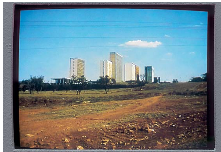
DOMINIQUE GONZALEZ-FOERSTER, BRASILIA HALL, 2000, detail.