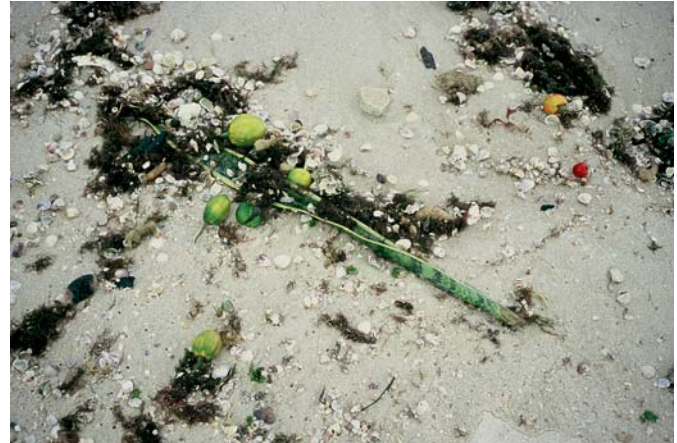
DOMINIQUE GONZALEZ-FOERSTER, BAHIA DESORIENTADA (REPÉRAGES) , ( Disoriented Bahia / Verwirrtes Bahia ), video, 2004.

flower arrangements, and, yes, entire cities, often inscribing cinematic elements into the urban landscape—be it a lush German park or a kunsthalle in the outskirts of Stockholm. This production of fascinatingly unfilled space is a kind of exhibition making, a curatorial practice that perhaps can be seen in the tradition of Lyotard’s Pompidou experiment. Gonzalez-Foerster, Parreno, and their generation are immaterialists.