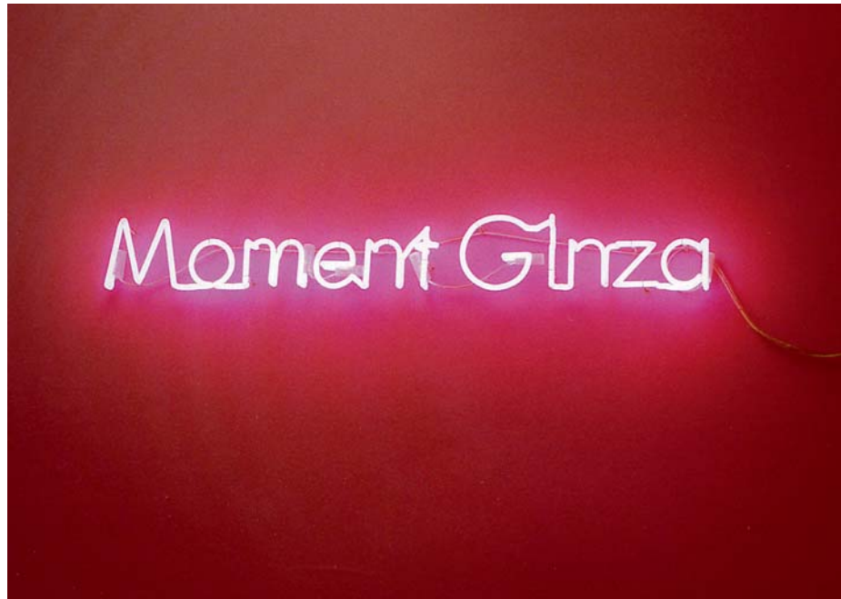
DOMINIQUE GONZALEZ-FOERSTER, MOMENT GINZA, 1999, pink neon on blue wall, ca. 7 3/4 x 47 1/4", installation view, Galerie Schipper & Krome, Berlin / Rosa Neon-Schrift auf blauer Wand, ca. 20 x 120 cm, Installationsansicht.