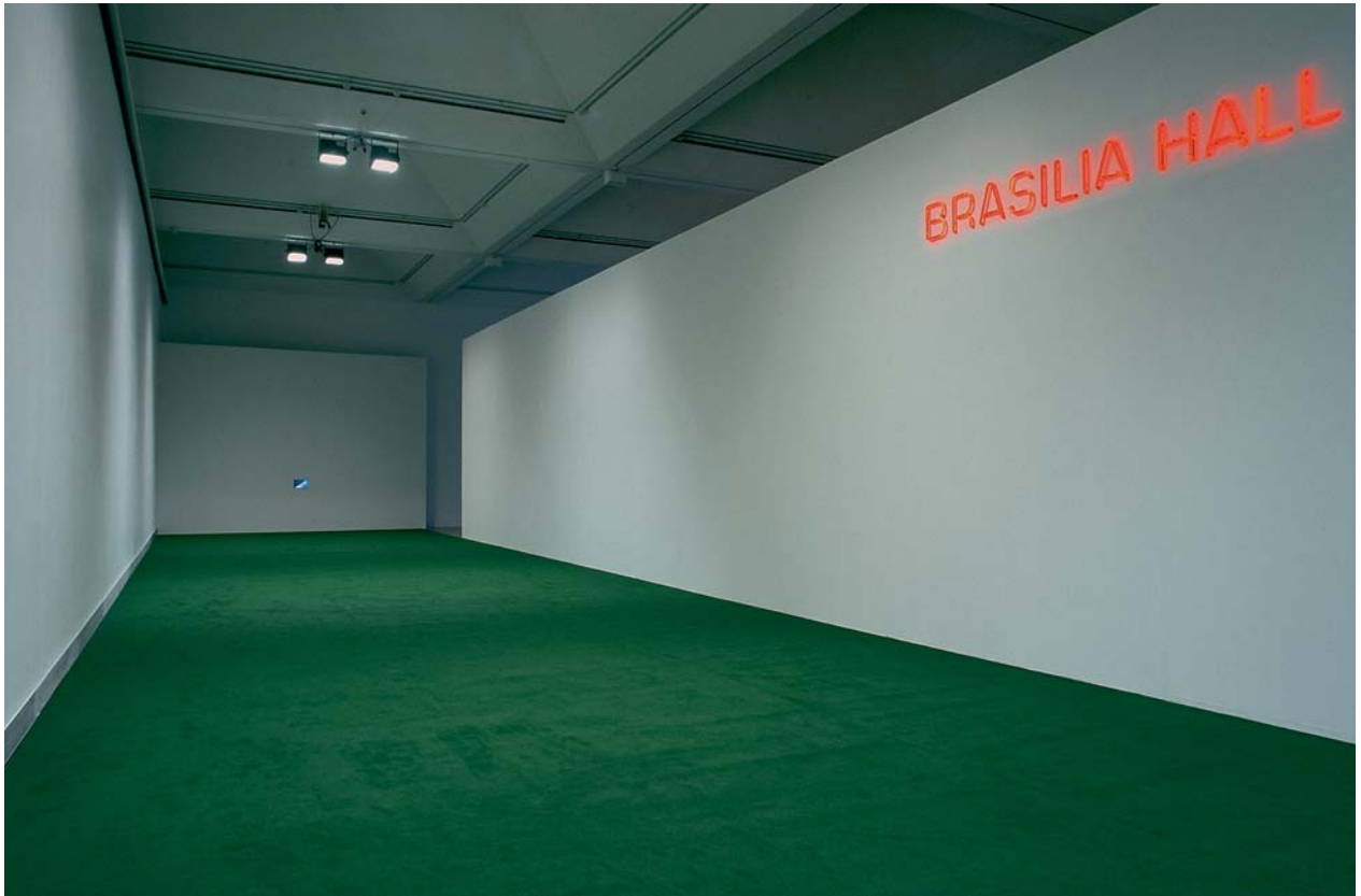
DOMINIQUE GONZALEZ-FOERSTER, BRASILIA HALL, 2000, installation view / Installationsansicht, Moderna Museet, Stockholm.