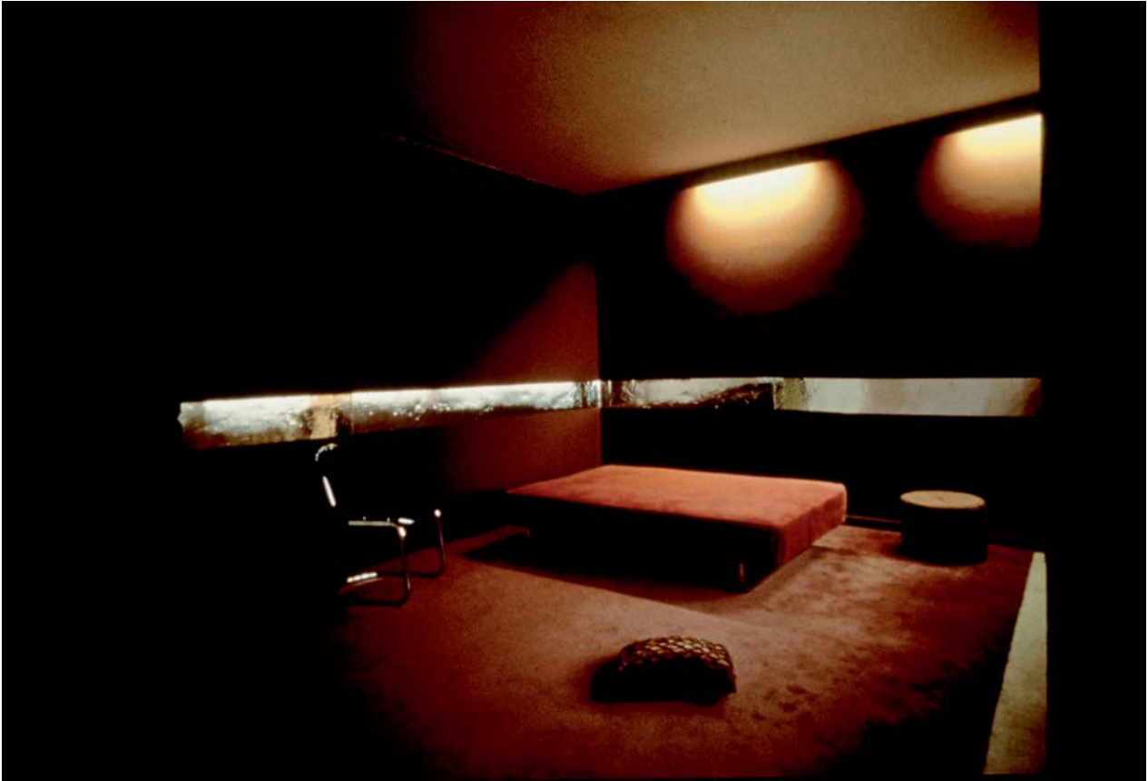
DOMINIQUE GONZALEZ-FOERSTER, RWF (CHAMBRE), 1993, installation view / Installationsansicht, Galerie Schipper & Krome, Köln.