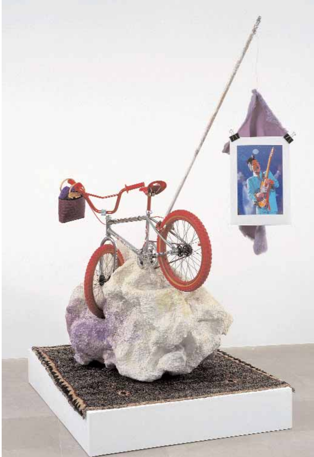
RACHEL HARRISON, MR. GOODNIGHT, 2007, wood, chicken wire, cement, Parex, acrylic, rug, BMX bicycle, pole, dyed sheep skin, Prince, handbag, potato, purple imitation Crocs, 99 x 86 x 54" / HERR GUTENACHT, Holz, Maschendraht, Zement, Parex, Acryl, Teppich, BMX-Fahrrad, Stange, gefärbtes Schaffell, Prince, Handtasche, Kartoffel, violette Imitat-Crocs, 251,5 x 218,4 x 137,2 cm.