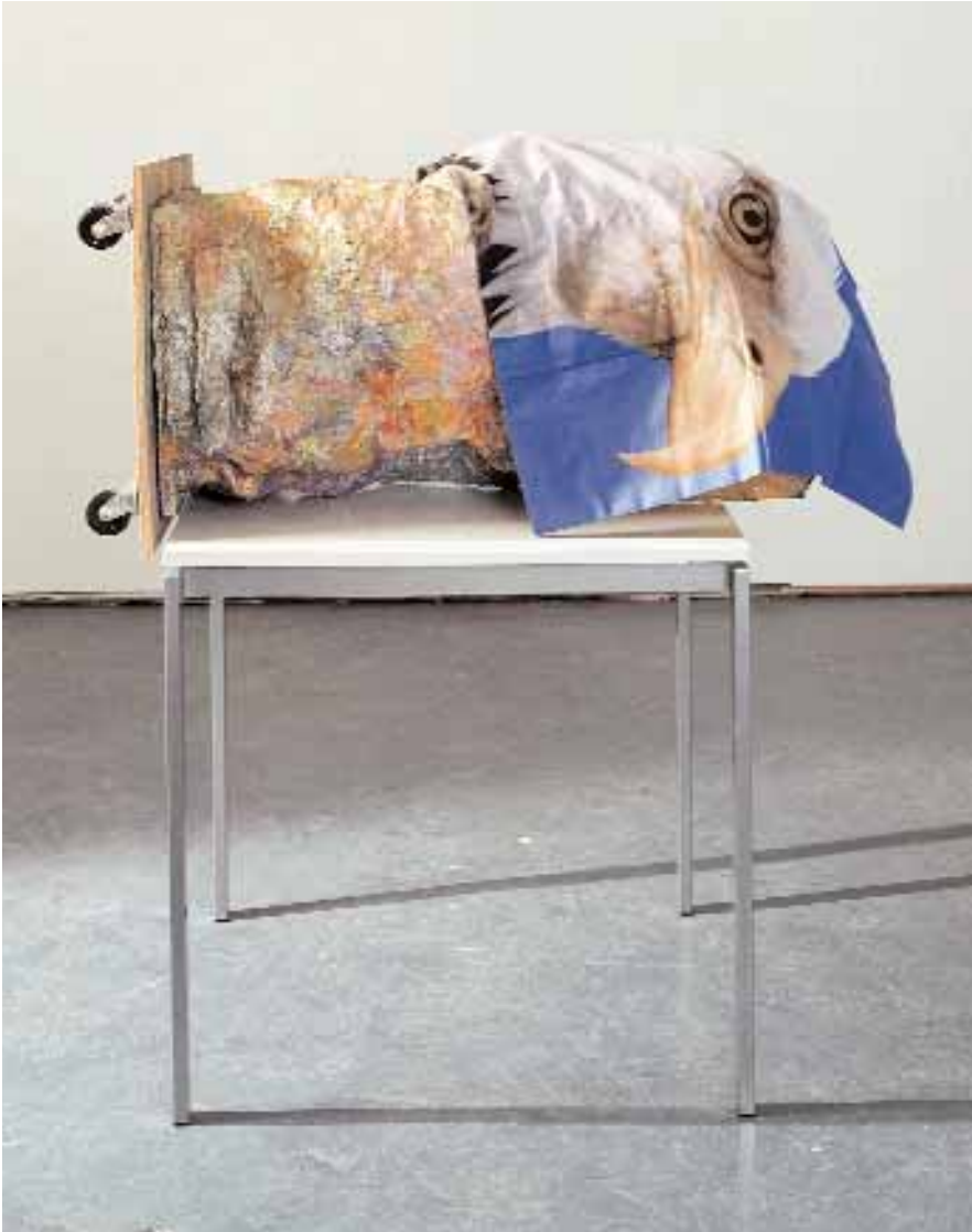
RACHEL HARRISON, THE EAGLE HAS LANDED , 2006, wood, polystyrene, chicken wire, cement, Parax, acrylic, wheels, pillowcase, table, 43 1/4 x 31 3/4 x 48 3/4" / DER ADLER IST GELANDET, Holz, Polystyrol, Maschendraht, Zement, Parax, Acryl, Räder, Kopfkissenbezug, Tisch, 110 x 81 x 124 cm.

ture. Auch wenn viele dieser Bilder auf nicht künstlerische Kontexte der Popkultur zurückgehen (besonders die Puppen) oder auf korsische Menhire, so bringt doch der Einbezug von Abbildungen der Werke Maillols, Brancusis, Dubuffets und von Rodins DIE BÜRGER VON CALAIS (1884) – auf engstem Raum mit diversen anderen Denkmälern, etwa von Judge Blackstone, Lady Bird Johnson und der altmodisch-schwerfälligen Statue von Gertrude Stein im Bryant Park – die Sache auf den Punkt: Es gibt auf der Welt wesentlich mehr Statuen als Skulpturen.