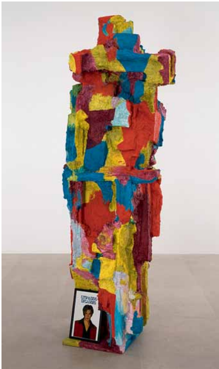
RACHEL HARRISON, AMERIGO VESPUCCI , 2006, wood, polystyrene, cement, Parex, acrylic, Leonardo DiCaprio mirror, 3 artificial apples, 86 1/2 x 31 x 29" / Holz, Polystyrol, Zement, Parex, Acryl, Leonardo DiCaprio-Spiegel, 3 künstliche Äpfel, 220 x 79 x 74 cm.

Distinctions between the figurative and abstract are never of much use. However, many tend to see Rachel Harrison's sculptures as abstract chunks on which figures appear, as sculpted display racks for varied bric-a-brac treasures. But this seems to largely miss the point. By decoding the brash pop-cultural references in Harrison's work, the tendency is to ignore the dense, equally punning layers of the artist's allusions to sculpture's primarily figurative past, that is statues.