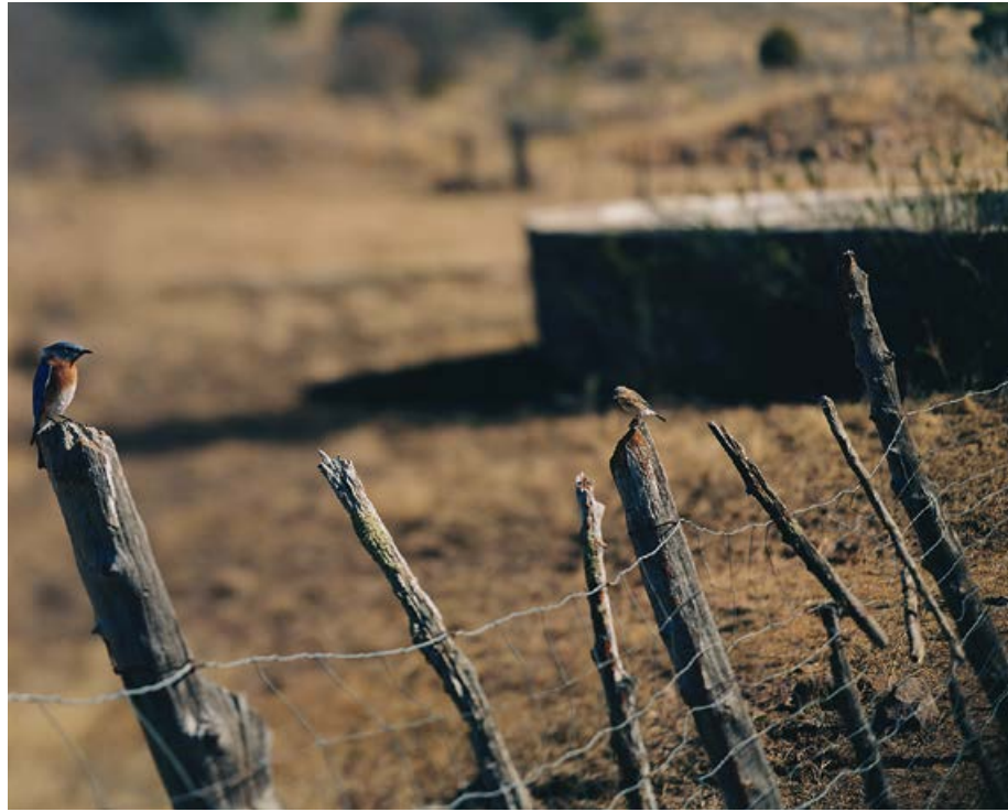
JEAN-LUC MYLAYNE, NO. 354, NOVEMBRE DÉCEMBRE 2005, 123 x 153 cm / 48 1/2 x 60 1/4".

Redaktion entschloss sich zu diesem Schritt in einer Zeit, in der die meisten Künstler und Autoren per Internet kommunizieren. Der Takt von nur zwei Ausgaben jährlich scheint heutzutage nicht mehr auszureichen, um am «Puls der Zeit» zu bleiben. Wir dürfen indessen nie aufhören, nach neuen Wegen des Dialogs zu suchen. Eine Gemeinschaft, die sich nicht bemüht, fremde Sichtweisen zu verstehen, ist dem Untergang geweiht. Auf abstrakter Ebene wird es notwendig sein, die Mechanismen und Strukturen der Kommunikation sichtbar zu machen, um deren Funktionsweise besser zu verstehen. Wir müssen die elementaren Spannungen und Widersprüche innerhalb der mobilen elektronischen Kultur nutzen, um ihr kommunikatives Potenzial freizusetzen, wie ja auch die Kunst der Mylaynes ihren Stoff aus den inneren Gegensätzen schöpft, die das Zeitalter der Globalisierung prägen. Das Künstlerpaar entschied sich für Mobilität ohne Telekommunikation, für Ein-