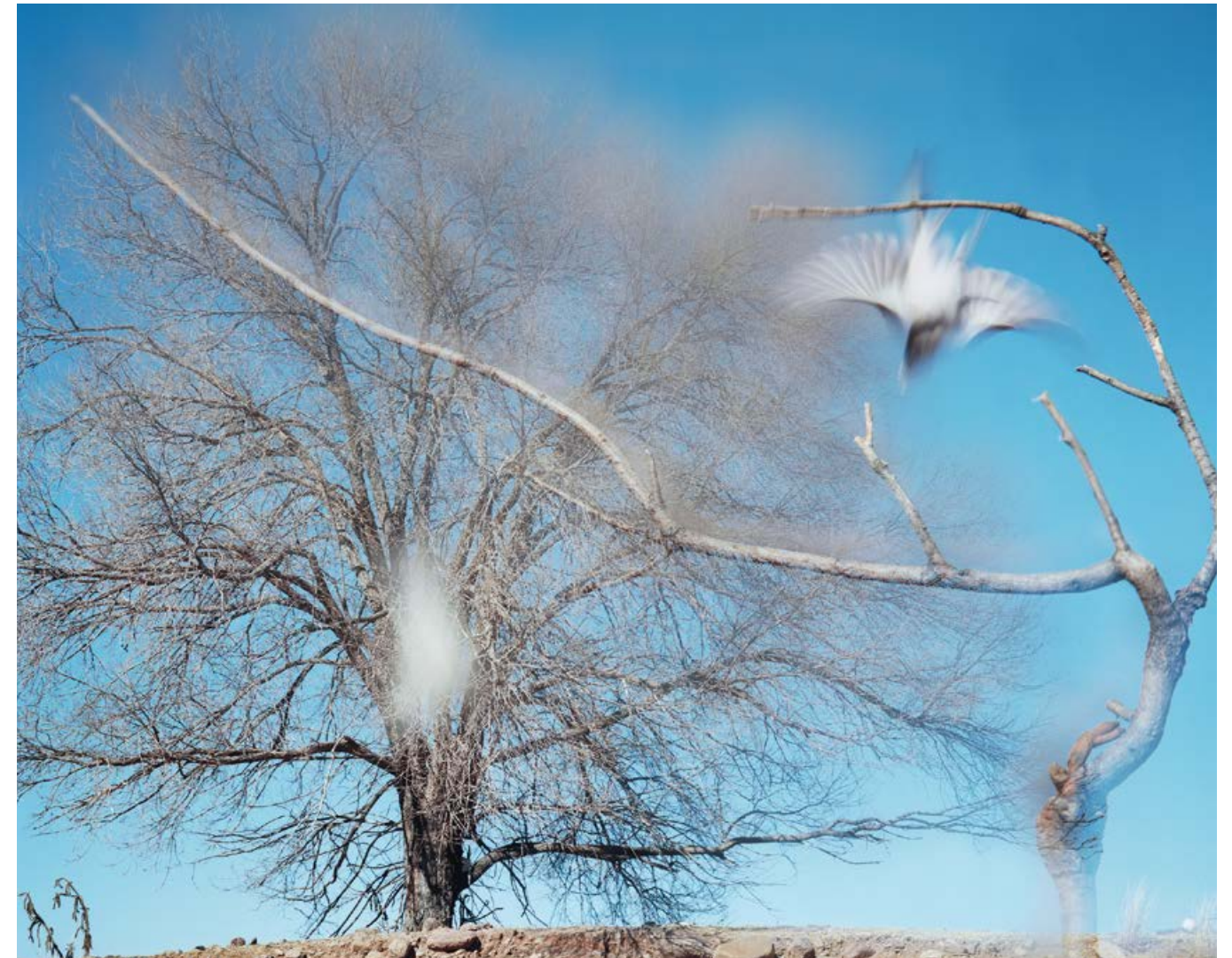
JEAN-LUC MYLAYNE, NO. 560, JANVIER FÉVRIER 2008, 185 x 230 cm / 72 7/8 x 90 1/2".