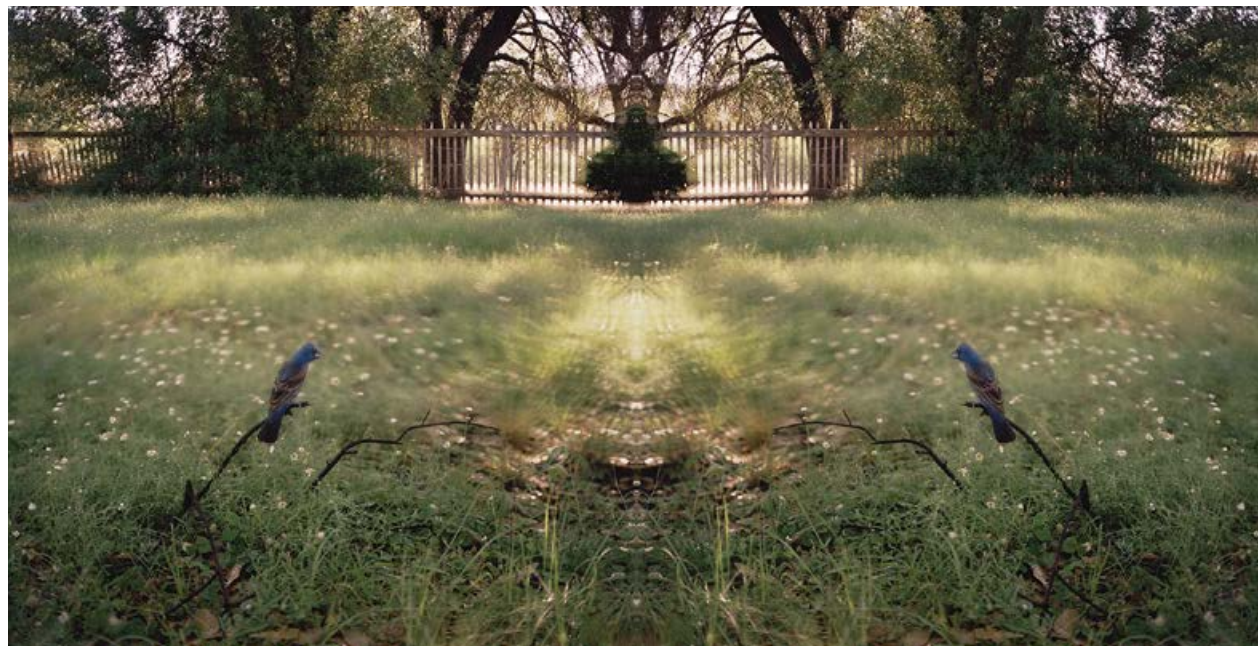
JEAN-LUC MYLAYNE, NO. 407, AVRIL MAI 2006, 153 x 303 cm / 60 1/4 x 119 1/4".

Beinahe ebenso lange, wie Mylayne seine photographischen Wanderzüge unternahm, beschritt Parkett eigenständige und einflussreiche Wege durch die Welt der Kunst. Abseits des ausgetretenen, von fast allen anderen Zeitschriften benutzten Pfads – Rezensionen, Neuigkeiten aus der Szene – pflegte man die Zusammenarbeit mit Künstlern an Büchern und Editionen, die den Charakter der Publikation ganz wesentlich bestimmte. (Mylayne steuerte zwei Parkett -Editionen für die Ausgaben von 1982 und 2001 bei.) Diese für Sammler interessanten Aktivitäten liessen sich ohne Weiteres fortsetzen, werden nun aber zusammen mit dem gedruckten Heft eingestellt. Die