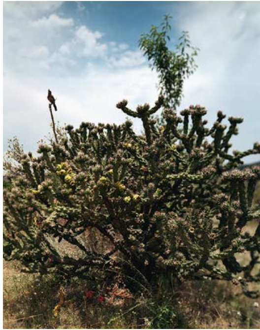
JEAN-LUC MYLAYNE, NO. 342, AVRIL MAI 2005, 228 x 183 cm / 89 3/4 x 72".

able to allow the slide-like superimposition of images that a digital device can easily create, but it cannot interact with the modes of knowledge circulation that predominate in a mobile e-world. Parkett and all print magazines seem like a sediment, a precipitate from the digital swirl.