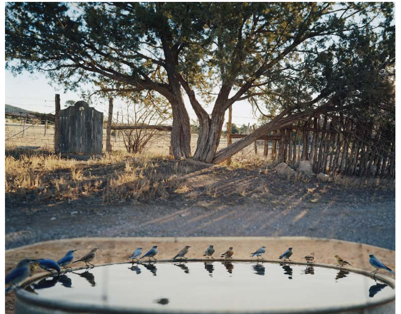
JEAN-LUC MYLAYNE, NO. 190, JANVIER FÉVRIER 2004, 185 x 230 cm / 72 7/8 x 90 1/2".

The Mylaynes found their idiosyncratic way through the conventionally connected world. Decidedly mobile—they "opted long ago for a path determined by the restless, shifting focus of his photographs, namely birds," as Fionn Meade put it in an essay published here in 2009—the couple bought a camper van in the late 1970s and succumbed to a "migratory pull." For years, they had no fixed address and, save for a radio, never owned any transmission devices. They