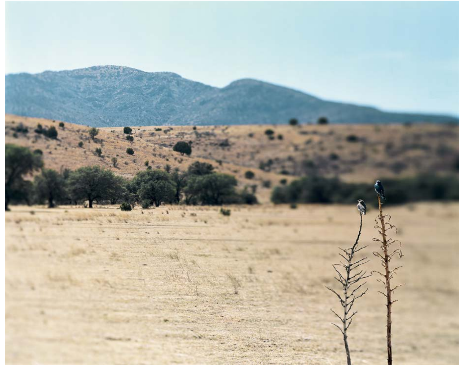
JEAN-LUC MYLAYNE, NO. 498 – NO. 499, JANVIER FÉVRIER MARS 2007, diptych, 180 x 225 cm / 70 7/8 x 88 5/8" each.