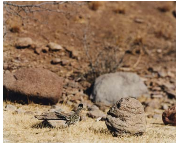
JEAN-LUC MYLAYNE, NO. 434, DÉCEMBRE 2007 – JANVIER 2008, 123 x 153 cm / 48 1/2 x 60 1/4".

It is wonderful to be led to such insights by the swipe of a pair of fingers on a laptop computer. The undertaking benefits from an extreme mobility of bodies and information exchange. I have all the published articles on Mylayne, as well as notes from nearly seven years of discussions and pictures from his exhibitions, stored on this very laptop. The portable setup allows me, for example, to write my thoughts while on an airplane, that grotesque yet remarkably efficient human imitation of birds. Not only is a print magazine, what we call hard copy, un-