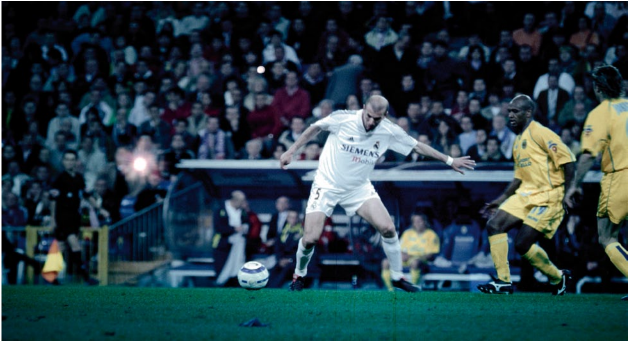
PHILIPPE PARRENO with DOUGLAS GORDON, ZIDANE: A 21st CENTURY PORTRAIT, 2006, film still / ZIDANE: EIN PORTRAIT DES 21sten JAHRHUNDERTS, Filmstill.

sensations. I was on my guard, distrustful, or in any case forewarned, like any good horror-film viewer.