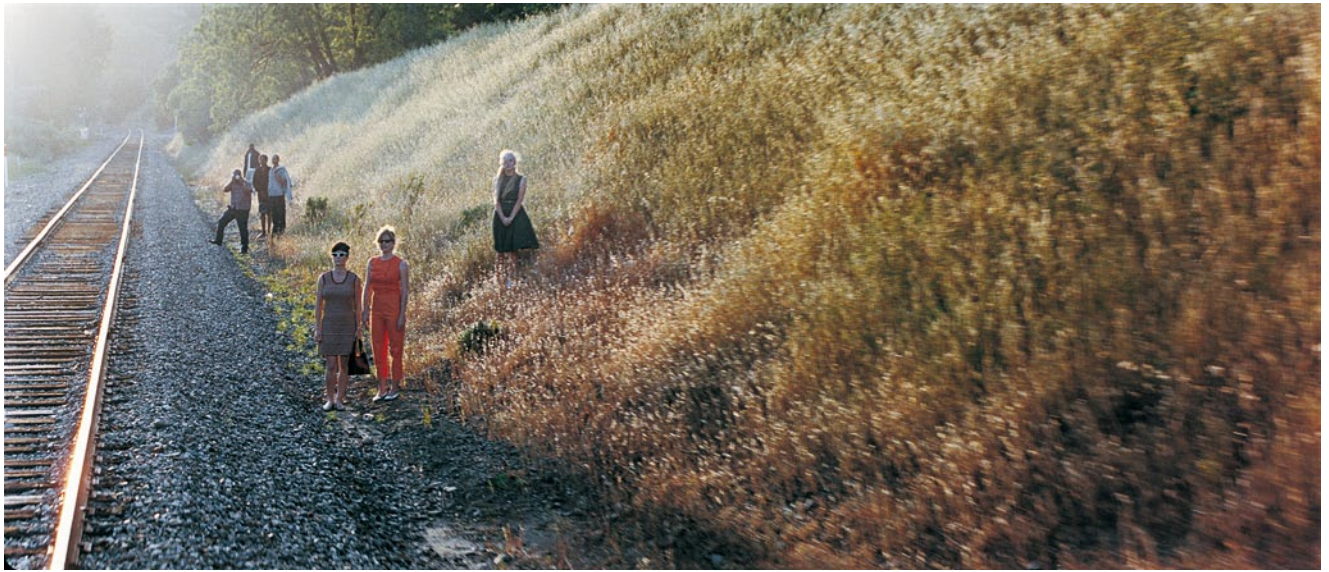
PHILIPPE PARRENO, JUNE 8, 1968, 2009, film stills, 70 mm film, approx. 8 min. / 8. JUNI, 1968, Filmstills, 70-mm-Film, ca. 8 Min.