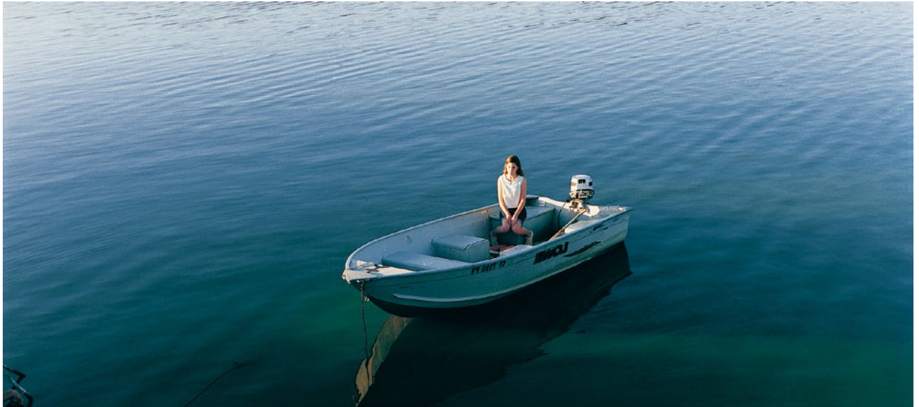
PHILIPPE PARRENO, JUNE 8, 1968, 2009, film still / 8. JUNI, 1968, Filmstill.