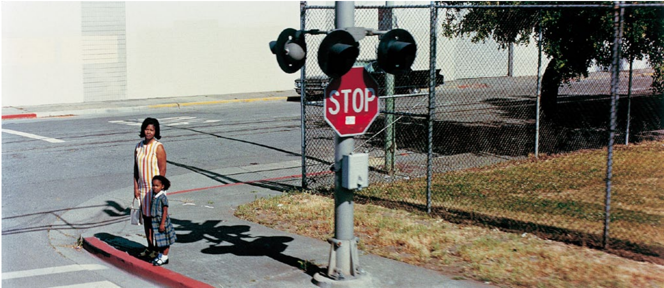
PHILIPPE PARRENO, JUNE 8, 1968, 2009, film still / 8. JUNI, 1968, Filmstill.

laubt hätten, wesentliche Fragen zu beantworten: Wer hat geschossen, von wo, und wie viele Male?