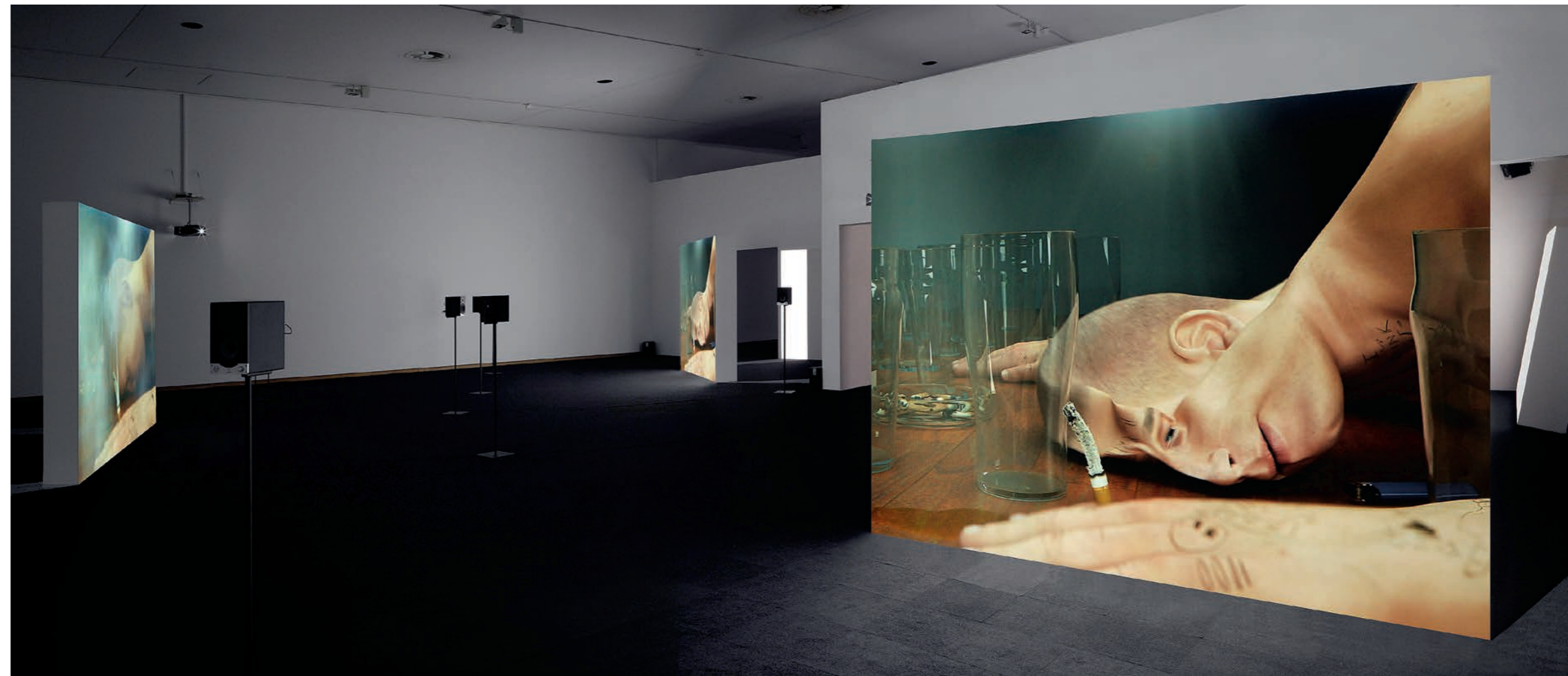
ED ATKINS, RIBBONS , 2014, installation view Stedelijk Museum, 2015 / BÄNDER , Installationsansicht.