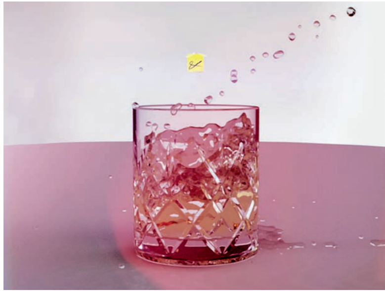
ED ATKINS, RIBBONS , 2014, 3-channel HD video (4:3 in 16:9) with 3 4.1 channel surround soundtracks, 13 min. / BÄNDER, 3-Kanal HD-Video (4:3 als 16:9) mit 3 4.1 Raumklang-Tonspuren.

being ashamed of my nose being too big, of my ass being too large, ashamed about the war in Yugoslavia.