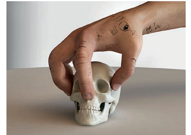
ED ATKINS, RIBBONS , 2014, 3-channel HD video (4:3 in 16:9) with 3 4.1 channel surround soundtracks, 13 min. / BÄNDER, 3-Kanal HD-Video (4:3 als 16:9) mit 3 4.1 Raumklang-Tonspuren.

Eve Kosofsky Sedgwick argues that the modern critique of sentimentality faults the "tacitness and non-accountability of the identification between sufferer