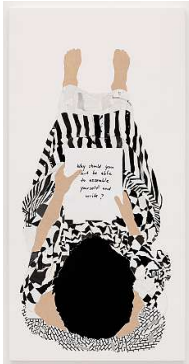
FRANCES STARK, WHY SHOULD YOU NOT BE ABLE TO ASSEMBLE YOURSELF AND WRITE? , 2008, rice paper, paper, ink on gessoed canvas on panel, 55 x 34" / WARUM SOLLTEST DU DICH NICHT SAMMELN KÖNNEN UND SCHREIBEN? , Reisepapier, Papier, Tinte auf grundierter Leinwand auf Tafel.

concerned with how one arranges oneself in relation to language. The question here is less how to make a first mark than how to organize a set of information and desires in relation to one's own person.