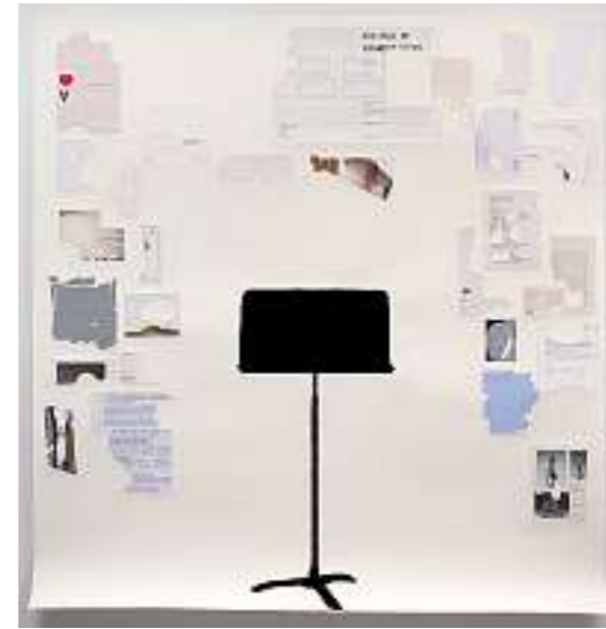
FRANCES STARK, TOWARD A SCORE FOR «LOAD EVERY RIFT WITH ORE» , 2010, paint, printed matter on paper, 86 3/4 x 79 1/4" / ZU EINER PARTITUR FÜR «FÜLLE JEDEN SPALT MIT EISEN» , Farbe, Drucksachen auf Papier, 220,3 x 201,3 cm.

ständigheit geworden, ebenso wie das Wissen, dass der Körper nicht im Zentrum der Aktivitäten steht, sondern bloss als Knoten in Kommunikationsnetzen und -kanälen erschrieben und beschrieben wird. Das bedeutet freilich nicht, dass er deswegen weniger von diesen Aktivitäten beeinflusst wird. Der Text mag sein eigenes Leben haben – er infiltriert trotzdem unsere Gehirne. Von dem Rummel um die Befreiung, die Avatare angeblich bringen sollen, bleibt die Erkenntnis, dass sich unsere Identität schwerer abschütteln lässt, als wir dachten. 6) Wir sitzen unent- rinnbar in unserem Ich gefangen. Die Projektion des Virtuellen auf das «Reale» erzeugt jene merkwürdigen, hybriden Spielformen der Subjektivität, die wir heute bewohnen.