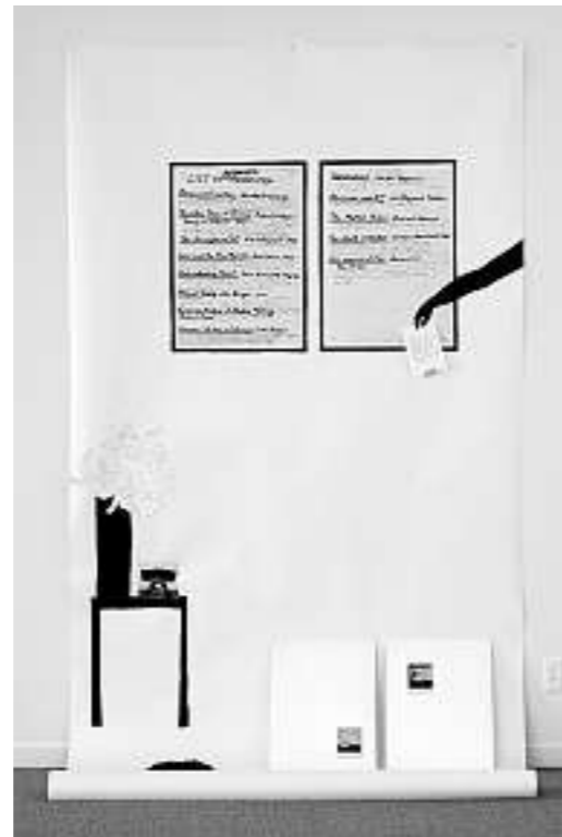
FRANCES STARK, «Memento Mori», 2013, exhibition view, detail, Paule Anglim Gallery, San Francisco / Ausstellungsansicht, Detail.

Die Vielfalt der Kommunikationsmöglichkeiten im Cyberspace öffnete und verflüssigte ihre Identitäten: «Die Mitspieler sind nicht nur Autoren von Text, sondern auch Schöpfer ihrer Identität, indem sie durch soziale Interaktion neue «Selbste» entwerfen.» 4) Ein solches Spiel konkretisiert eine Reihe von Thesen, die mit den französischen Theoretikern in Verbindung stehen und dem Internet vorausgehen, nämlich «das Selbst werde über und durch die Sprache konstituiert, der Geschlechtsverkehr bestehe im Austausch von Signifikaten und jeder einzelne sei eine Vielfalt von Bruchstücken, verbunden durch Begehren». 5) Turkles Beobachtungen werfen ein Schlaglicht auf die damalige Situation, beschreiben aber noch weitaus treffender die Welt, in der wir uns zwei Jahrzehnte später befinden. Die Multiplizität der Verbindungs- und Wunschkanäle ist zur Selbstver-