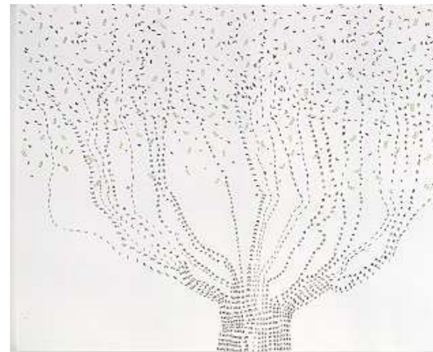
FRANCES STARK, FREE MONEY , 2004, ink, gouache on casein on canvas board, 20 x 24" / GELD UMSONST , Tinte, Gouache auf Kasein auf Leinwandplatte, 50,8 x 61 cm.