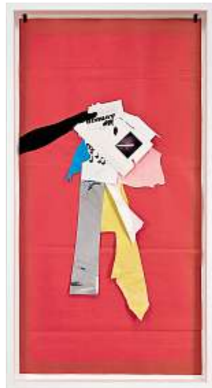
FRANCES STARK, I WENT THROUGH MY BIN YET AGAIN , 2008, mixed media on paper, 53 3/4 x 27 1/2" / WIEDER SUCHTE ICH IM ABFALLEIMER , verschiedene Materialien auf Papier, 136,5 x 69,8 cm.

ALEX KITNICK is an art historian based in New York.