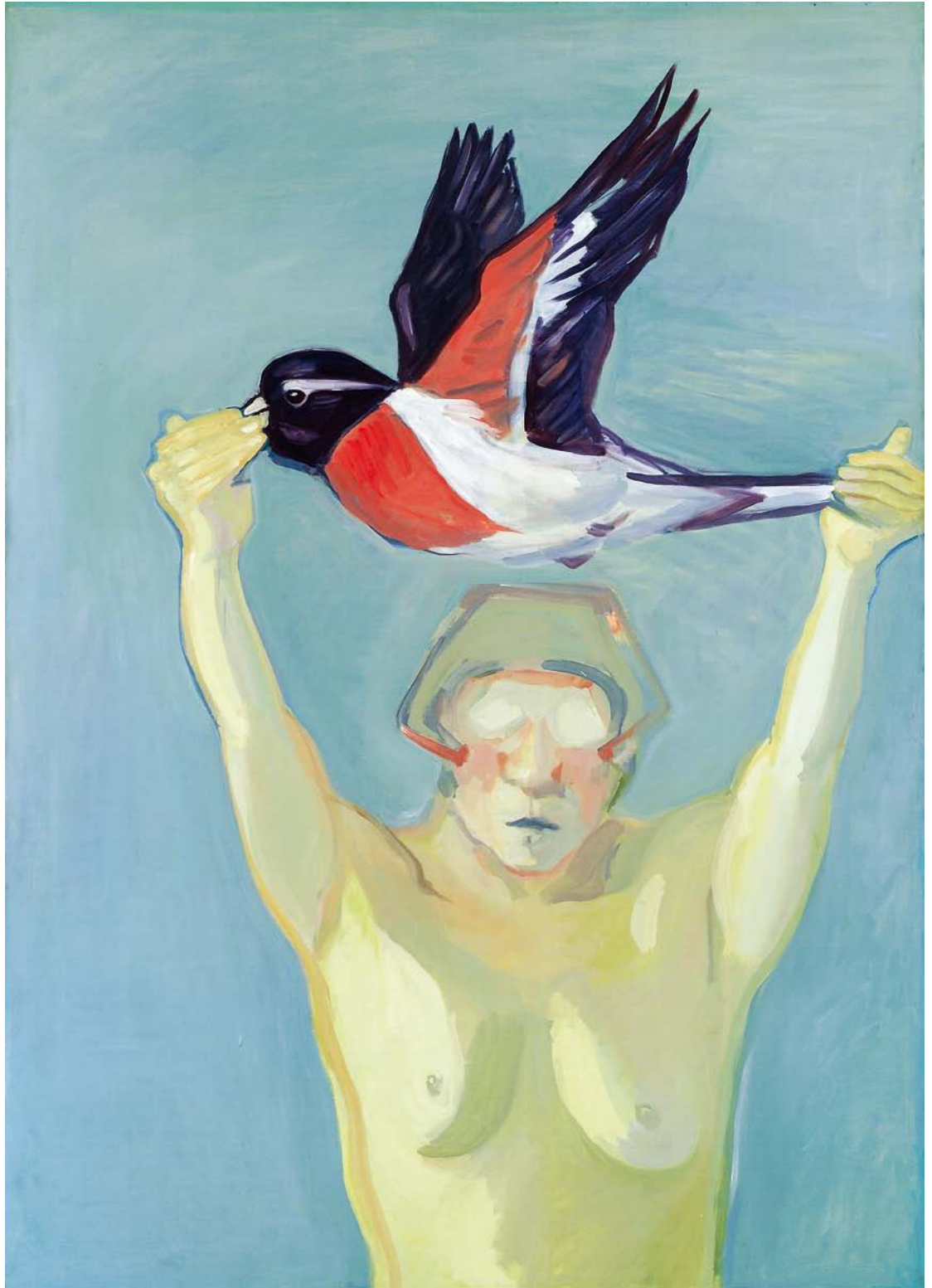
MARIA LASSNIG, LEARNING TO FLY , 1976, tempera on canvas, 69 3 / 4 x 67 3 / 4 " / FLIEGEN LERNEN , Tempera auf Leinwand, 177 x 172 cm.