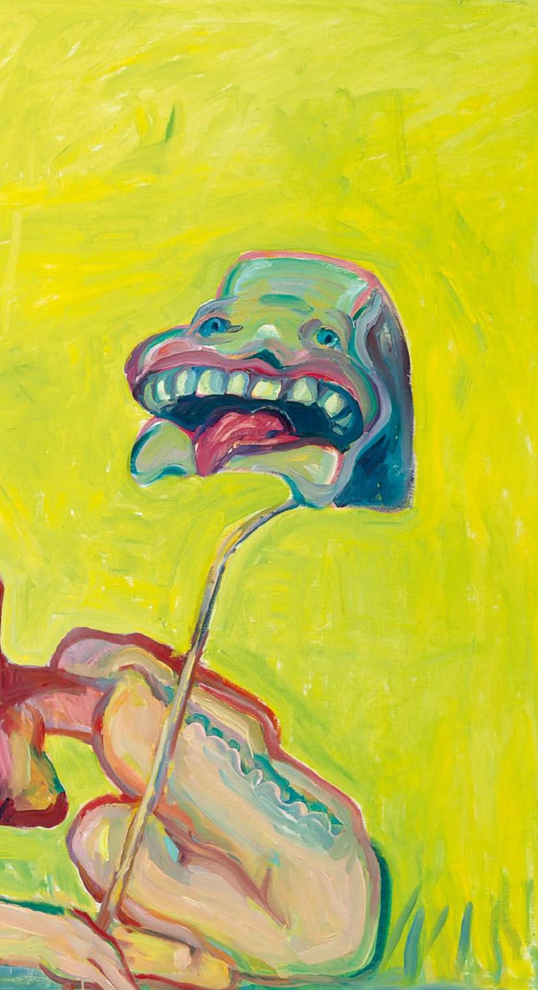
MARIA LASSNIG, PHOTOGRAPHY AGAINST PAINTING, 2005, oil on canvas, 59 x 78 3/4" / PHOTOGRAPHIE GEGEN MALEREI, Öl auf Leinwand, 150 x 200 cm.