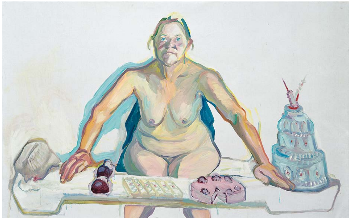
MARIA LASSNIG, MADONNA OF THE PASTRIES, 2001, oil on canvas, 59 x 78 3 / 4 " /

MEHLSPEISENMADONNA, Öl auf Leinwand, 150 x 200 cm.