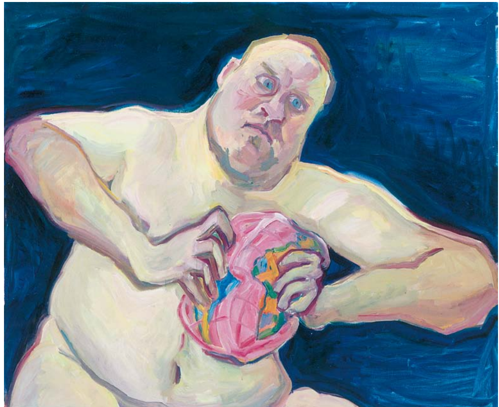
MARIA LASSNIG, THE WORLD DESTROYER , 2001, oil on canvas, 39 1/4 x 49 1/4" / DER WELTZERTRÜMMERER, Öl auf Leinwand, 100 x 125 cm.