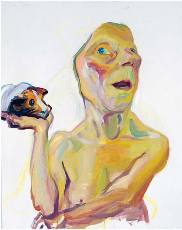
MARIA LASSNIG, SELF WITH GUINEA PIG , 2000/2001, oil on canvas, 49 1/4 x 39 1/4" / SELBST MIT MEERSCHWEINCHEN , Öl auf Leinwand, 125 x 100 cm.

Science fiction, by contrast, was able to imagine the species as one of many, and perhaps the least likely to endure in any contest for survival among the fittest that allowed mutants and robots to participate. Not the least of the harbingers of the art world vogue for sci-fi was the appearance of Robby the Robot—pseudo-mechanical “star” of the outer space thriller Forbidden Planet —in the seminal proto-pop exhibition “This is Tomorrow” at the Whitechapel Art Gallery in London in 1956. Organized by the Independent Group, which included architectural theorist Reyner Banham, curator and critic Lawrence Alloway, and artists Richard Hamilton and Eduardo Paolozzi, “This is Tomorrow” was among the rare avant-garde shows that actually foresaw the future—albeit the future of art as a product of commodity culture rather than the future of mankind as machine. Of course, Paolozzi’s sculptures of the late fifties and early six-