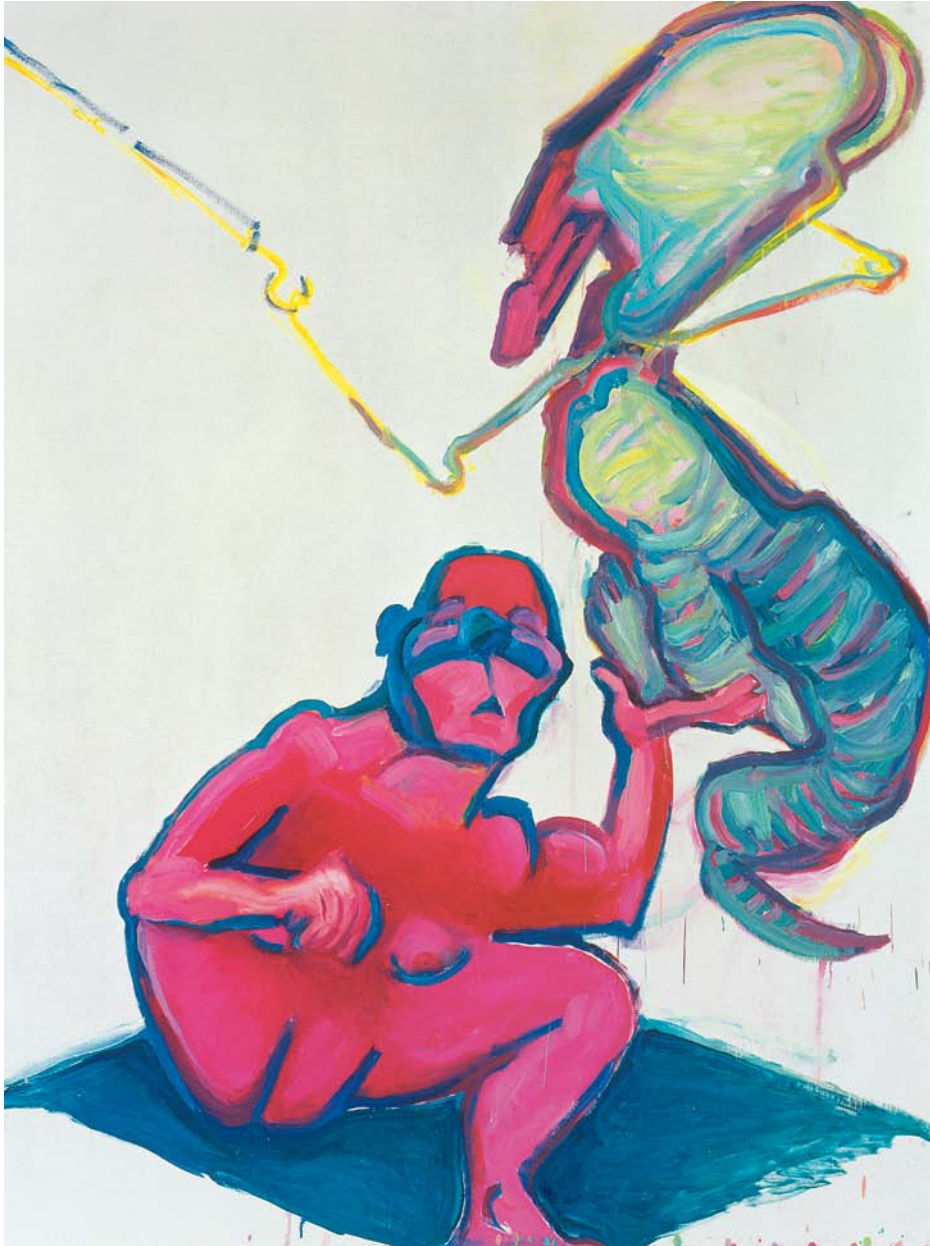
MARIA LASSNIG, SELF WITH DRAGON , 2005, oil on canvas, 78 3 / 4 x 59" / SELBST MIT DRACHEN , Öl auf Leinwand, 200 x 150 cm.