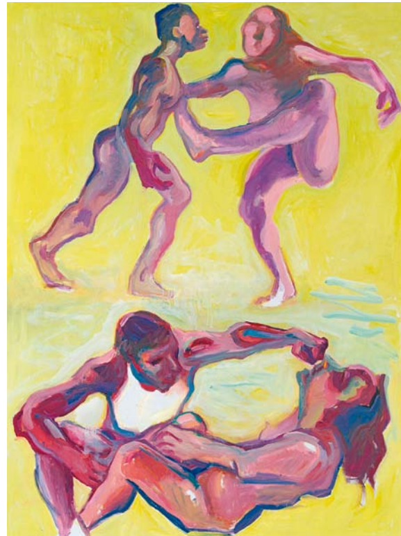
MARIA LASSNIG, ADAM AND EVE IN QUARREL, 2005, oil on canvas, 80 1/4 x 60 1/2" / ADAM UND EVA IM ZWIST, Öl auf Leinwand, 204 x 154 cm.

In den 50er-Jahren experimentierte Lassnig durchgehend mit sehr lebendigen, aufs Wesentliche