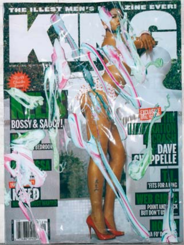
Left / Links: KELLEY WALKER, SCHEMA; AQUAFRESH PLUS CREST WITH WHITENING EXPRESSIONS (TRINA) 2006, digital print on paper from CD-ROM, dimensions variable, installation view, "Fuori Uso Altered States: Are you experienced?", Pescara, 2006 / Digitaler Print auf Papier von CD-ROM, Masse variabel, Installationsansicht.