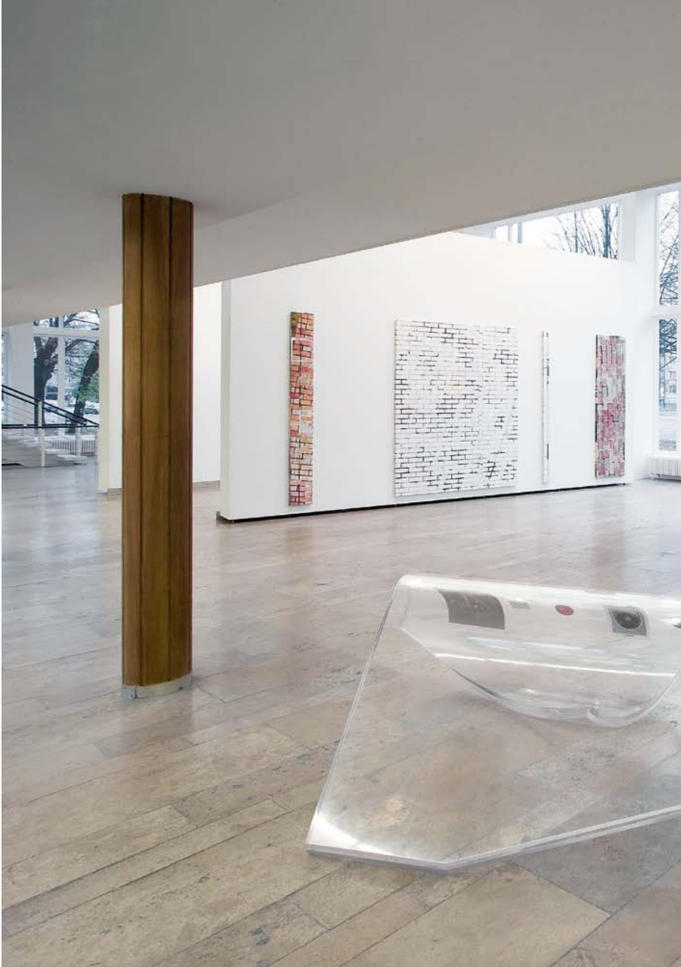
KELLEY WALKER, installation view, Captain Petzel, Berlin, 2009 / Installationsansicht