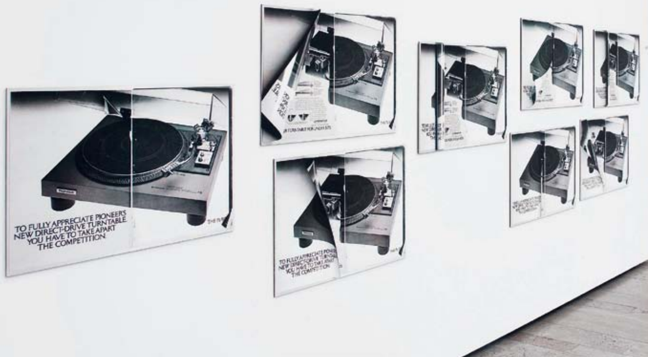
KELLEY WALKER, PIONEER PL-518 SERIES, 2009, detail, 4-color process silkscreen with acrylic ink on MDF, suite of 10 panels, 22 3/4 x 33 x 1/4" each, installation view Captain Petzel, Berlin, 2009 / 4-farbiger Siebdruck mit Acryltinte auf MDF, Folge von 10 Tafeln, je 57,8 x 83,8 x 0,6 cm.

Installation für seine Ausstellung (grösstenteils geraume Zeit vor dem Transport nach Deutschland) genau auszuarbeiten. Trotzdem: Die merkwürdige Aufgeregtheit, die der Künstler und seine Assistenten beim ansonsten gelassenen Zusammenbau eines mehr oder weniger massstabgetreuen Modells an den Tag legten – um von dessen Ehrenplatz auf einem Tisch in der Mitte des Ateliers ganz zu schweigen –, machte (auf mich jedenfalls) den Eindruck, dass mehr auf dem Spiel stand als das blosse Austüfteln pragmatischer Fragen. Wenn der Grund für den Bau eines solchen Modells vordergründig darin besteht, die Dynamik und Dimensionen eines Raumes schnell und effizient in den Griff zu bekommen, so hatte Walkers Herangehensweise etwas Verdrehtes – oder vielleicht besser gesagt: etwas Verqueres – an sich.