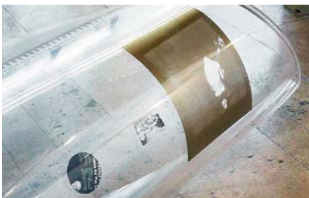
KELLEY WALKER, WAVE , 2009, details, Plexiglas, magazine pages, 2 parts, 23 2/9 x 59 4/5 x 97 3/5" each / WELLE , Details, Plexiglas, Zeitschriften-Seiten, 2 Teile, je 59 x 151,9 x 247,9 cm.

an Schallplatten gemahnende Kreise – geschnitten und folglich doppelt abstrahiert. Diese sonderbaren skulpturalen Entfaltungen von Zeit und Raum bieten gleichzeitig ihre Ware an und halten sie doch fest, Sammlungen von Bildern enthaltend, die, so scheint es, die Antriebe und Triebe des Künstlers zu katalogisieren scheinen. Tatsächlich wurden diese Bilder, so, wie ich sie im Atelier sah, von Walker in einem anwachsenden Archiv gesammelt, das sehr persönlich wirkte, auch wenn sie sich über die verschiedenen Gattungsgrenzen hinwegsetzten: Bilder von schwulem Treiben, von Sex an öffentlichen Orten bis hin zu Transvestiten-Divas, aufgenommen von einem Photographen namens Toby Old, von dem ich vorher nie gehört hatte; archivalische Ephemera, darunter eine (von Vince Aletti erhaltene) Einladung zu The Loft, verschiedene Ausgaben von James Browns Album Hot Pants aus dem Jahr 1971, die meisten davon in Plattenhüllen mit Abbildungen von Körperteilen schwarzer Frauen (überwiegend Ärsche) darauf, schwuler Männerporno (einschliesslich solch beliebter Genres wie «Wassersport»). Bei Capitain Petzel machen die Skulpturen aus diesen Bildern in ihrer indirekten Verfügbarkeit allerdings etwas ganz und gar