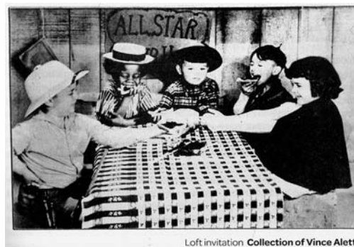
Loft invitation