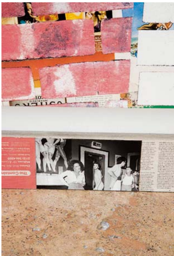
KELLEY WALKER, UNTITLED , 2009, detail, layered New York Times , wheatpaste, dimensions variable / OHNE TITEL, geschichtete Zeitungsseiten ( New York Times ), Kleister, Masse variabel.

nothing of its pride of place on a table in the middle of the studio—suggested (to me, at least) that more was at stake than the mere figuring of pragmatics. Indeed, if the ostensible reason for constructing such a model is to quickly and efficiently get a handle on real-world spatial dynamics and dimensions, something about Walker’s approach felt, I realized, twisted —or, perhaps better put, askew.