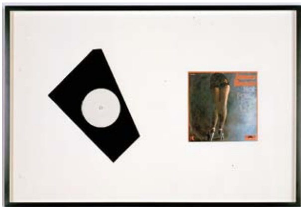
KELLEY WALKER, UNTITLED , 2009, vinyl record, 45 rpm, James Brown record cover mounted on paper, framed, 30 1/2 x 20 1/2 x 1 1/2" / OHNE TITEL , Vinyl-Schallplatte, Plattencover auf Papier, gerahmt, 77,5 x 52,1 x 3,8 cm.

landet. Könne es nicht erwarten, sie zu sehen.» In anderen wiederum ist sie weniger nuanciert. Zum Beispiel ein grossformatiges, überwiegend bildgestütztes Gemälde mit ganzseitigen Reportagen und Anzeigen: ein Artikel von Vince Aletti über die Rolling Stones, das neue Album «Chocolate Chip» von Isaac Hayes, ein Beitrag über «Disco Kids in Gay L.A.»