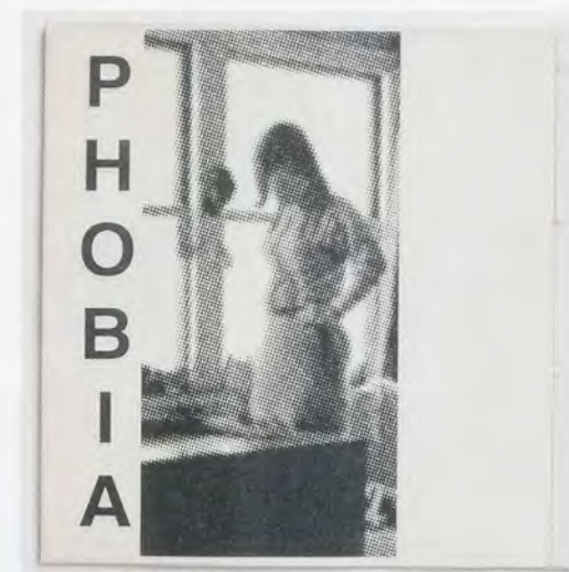
ROSEMARIE TROCKEL, PHOBIA , 1988, leaflet with cardboard back, thread stitching on the right, printed tracing paper, 8 1/8 x 8 1/8" / PHOBIE , Heft mit Pappprücken, Fadenbindung rechts, bedrucktes Pauspapier, 20,8 x 20,8 cm.

Rather than read each book draft on its own, however, as an unrealized proposal for a work yet to come, and attempt to analyze each one based on its title and image, I suggest that we understand them as a key to Trockel's creative process as a whole. Few artists have distinguished themselves by such a radical process-based practice, wildly divergent styles, materials, and scales, and unique creativity, in which recurrent figures and motifs abound. I want to suggest that the relatively modest formal inventions of the book drafts, or more precisely, their tightly controlled and circumscribed range of formal innovations structured by the design conventions of book