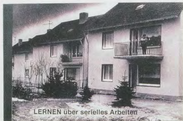
ROSEMARIE TROCKEL, LERNEN ÜBER SERIELLES ARBEITEN, 1993, book with printed photos on tracing paper, glossy cover, adhesive binding, 6 5/8 x 9 1/2" / Buch mit Photoausdrucken auf Pauspapier, Glanzcover, Klebebindung, 16,8 x 24,1 cm.