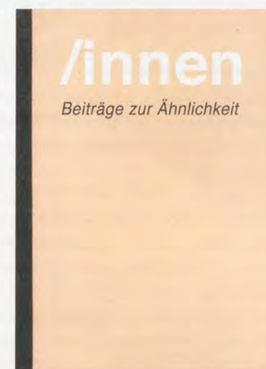
ROSEMARIE TROCKEL, /INNEN. BEITRÄGE ZUR ÄHNLICHKEIT, 1987, leaflet with cardboard back, adhesive binding, printed on cardboard, foil cover, inside: ink, collage, and graphite on paper, 11 x 8 1/8" / /INNEN. CONTRIBUTIONS ON RESEMBLANCE, Heft mit Kartonrücken, Klebebindung, Druck auf Karton, Foliencover, innen: Tusche, Collage und Graphit auf Papier, 28,1 x 20,8 cm.