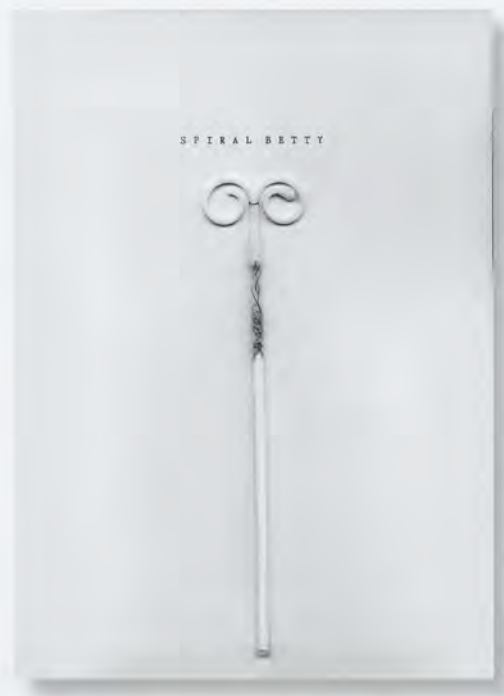
ROSEMARIE TROCKEL, SPIRAL BETTY , typewriter, graphite, plastic, thread on paper, 10 1/4 x 7 1/2" / Schreibmaschine, Graphit, Plastik, Faden auf Papier, 26 x 18,9 cm.

sharp-witted, and full of puns, but most of their distinct wordplay is in German and difficult to translate; their linguistic specificity must have made that first presentation in New York all the more mysterious. Often, a title is accompanied by a drawn or pasted image (as in COLD OBSERVATORIUM , 1986, which features the title and a drawing of a human brain), unless the title has been placed directly atop a found photograph or printed image (as in DU-WER IST DER ABSOLUTE EIGENTÜMER [You-Who Is the Absolute Owner], 2002), in which the title is printed on a full-bleed image of a house facade. Trockel's compositions are simple: Words and phrases are usually stacked or aligned, while the image either covers the entire field of the paper or is arranged in a simple graphic relationship to the text; sometimes a visually interesting binding, spiral or hand-stitched, complements the composition. Some book drafts are conceived as parts of a series, with recurring design motifs or numbered titles (as in LEICHTES UNBEHA-