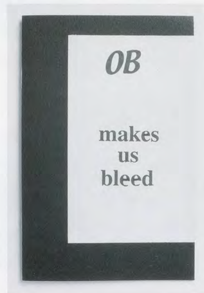
ROSEMARIE TROCKEL, OB MAKES US BLEED , 1984, leaflet, black board, printed cover, marker on paper (20 pages), 6 1/2 x 4 1/4" / Heft aus schwarzer Pappe, bedrucktes Cover, Filzstift auf Papier (20 Seiten), 16,5 x 10,8 cm.

objects and installations. Yet while seemingly marginal to Trockel's oeuvre—either deeply private, a caprice, or a decoy, a trap—these works have been included in all of the artist's major surveys since Dia, suggesting a much more significant role. It was in 2005, at Museum Ludwig, Cologne, that they were first exhibited under the designation of "book drafts" ( Buchentwürfe ).