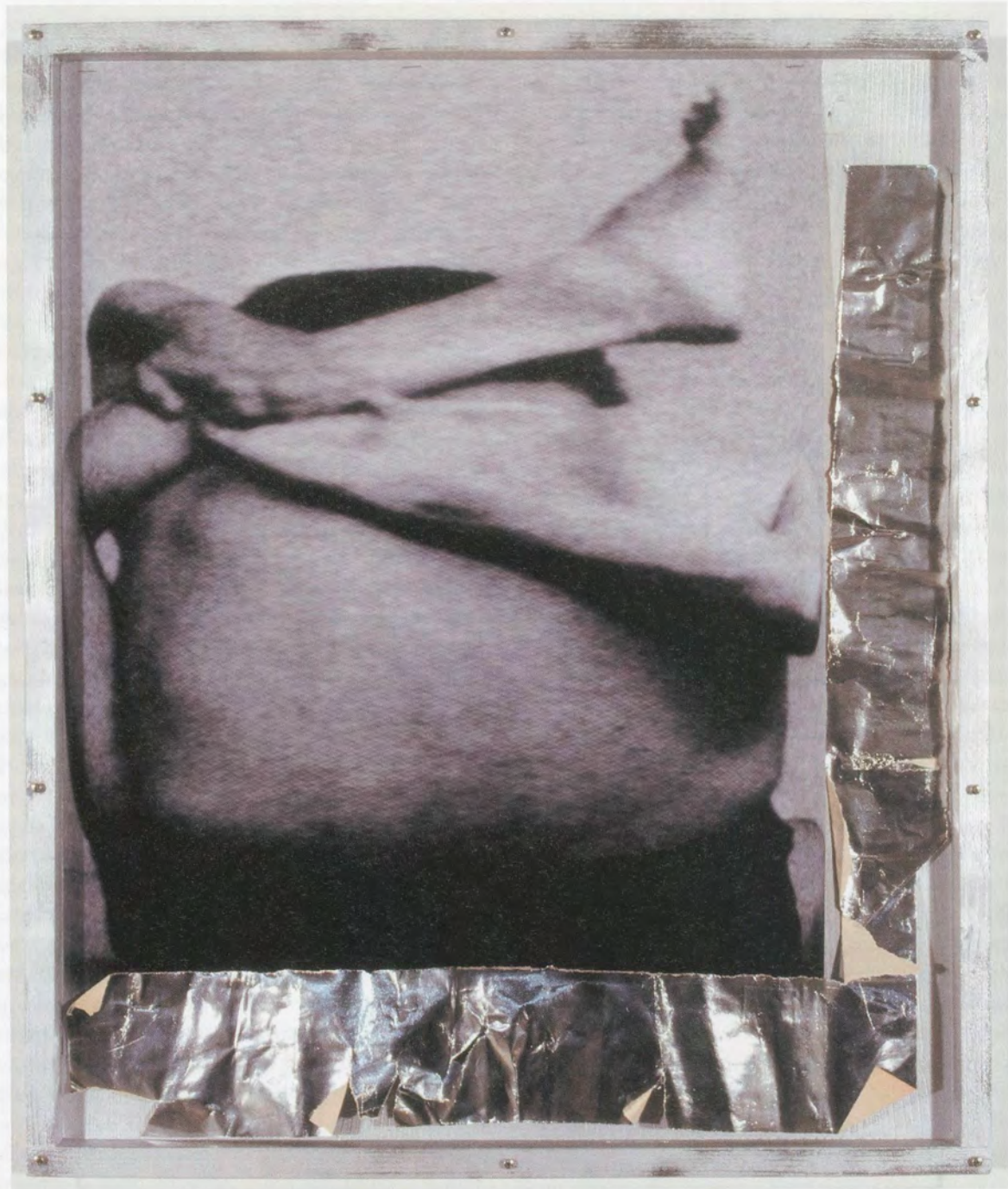
ROSEMARIE TROCKEL, ORNAMENT, 2006, mixed media, 26 1/2 x 22 1/2 x 1 1/2" / Verschiedene Materialien, 67,5 x 57 x 3,8 cm.