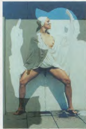
K8 HARDY, K8 IN SHORTS WITH SILHOUETTE BEHIND WITH MIDDLE FINGER, Position Series 53, 2011, photographic print, 20 3/8 x 31 1/8 x 1 1/2" / K8 IN SHORTS MIT SILHOUETTE HINTER MITTEL- FINGER, Print, 53 x 79 x 4 cm.

sein. Wenn man jemanden um einen Dienst bittet, muss man bereit sein, dafür zu bezahlen.