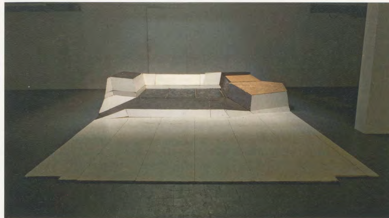
OSCAR TUAZON, BED , 2010, OSB, steel, paint, exhibition view "Sex," Jonathan Viner Gallery, London / BETT, Großspanplatte , Stahl, Farbe, Ausstellungsansicht.

K8: A bag of clothes, some wigs, a camera. And maybe some make-up. Maybe not. I'm successfully putting less and less effort into how I style or dress myself (laughs). At first there was a believability about the styling and the looks. But now the gesture of it is get-