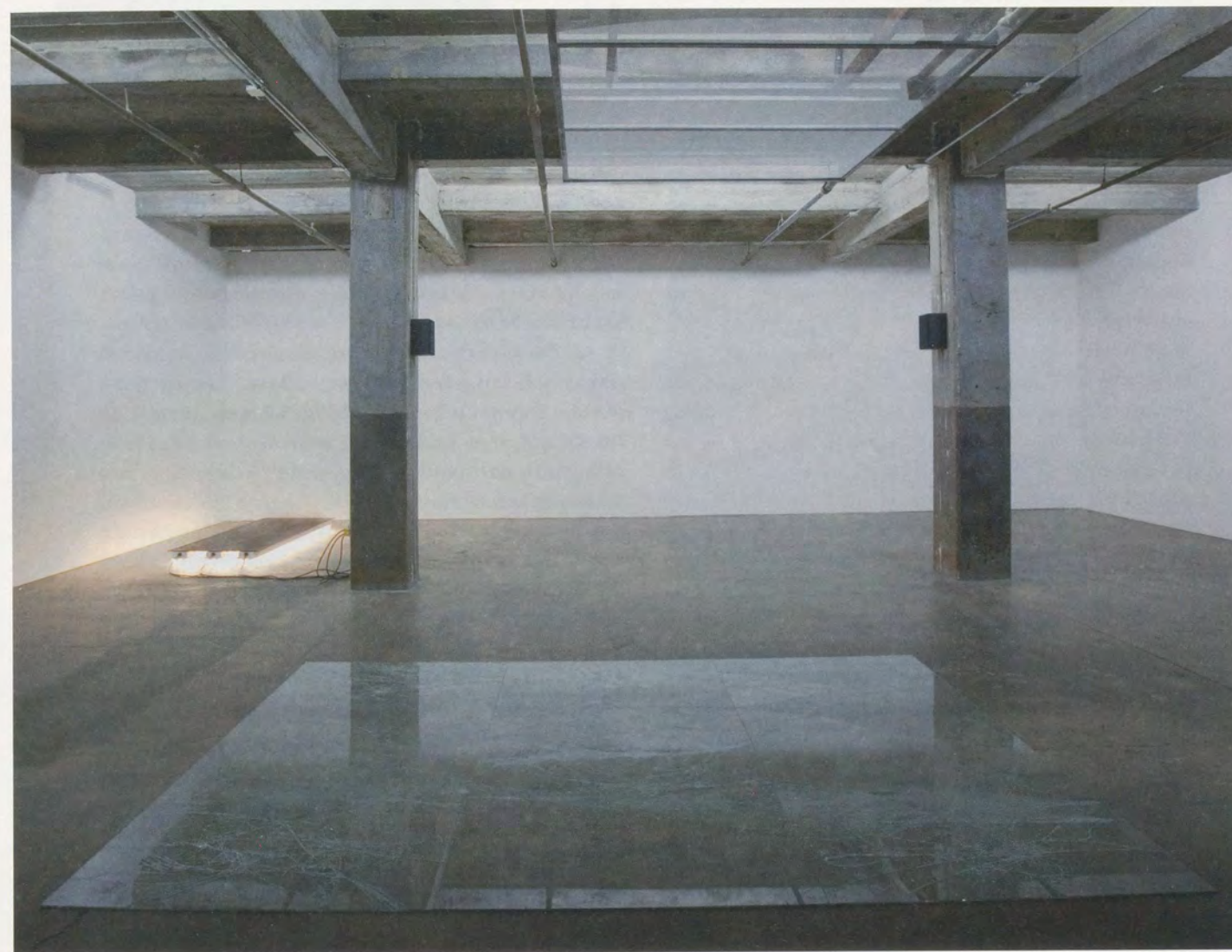
OSCAR TUAZON, MY FLESH TO YOUR BARE BONES, 2010, installation view, Maccarone, New York / MEIN FLEISCH ZU DEINEN BLANKEN KNOCHEN, Installationsansicht.