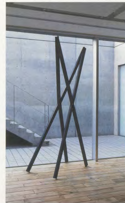
OSCAR TUAZON, A DEAD THING, exhibition view "Sex Booze Weed Speed," Rat Hole Gallery, Tokyo, 2010 / EIN TOTES DING, Ausstellungsansicht.

* Working Artists and the Greater Economy (W.A.G.E.) ist eine 2008 gegründete Aktivistin- und Bewusstseins-Gruppierung in New York.