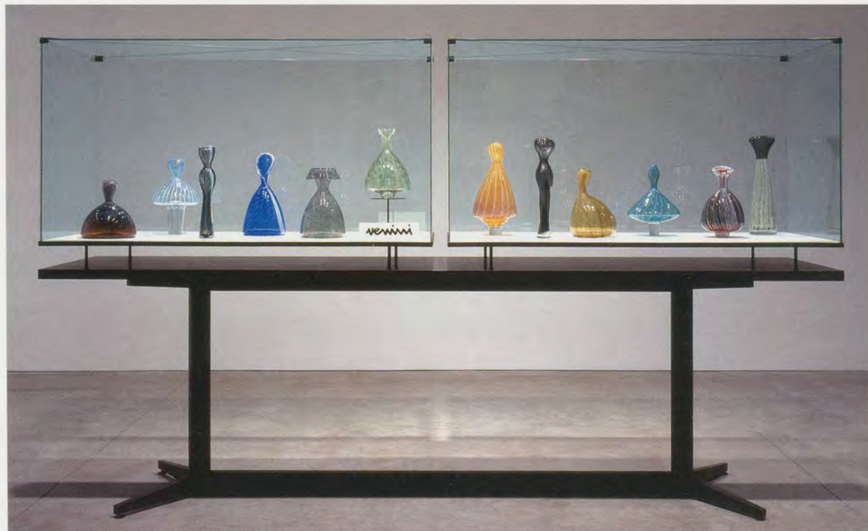
JOSIAH McELHENY, FROM AN HISTORICAL ANECDOTE ABOUT FASHION, 2000, detail, hand-blown glass objects, display case, 5 framed digital prints, dimensions variable, display case, 72 x 120 x 27”, digital prints 18 x 25 1/2” each / AUS EINER HISTORISCHEN ANEKDOTE ÜBER DIE MODE, Ausschnitt, mundgeblasene Glasobjekte, Vitrine, 5 gerahmte digitale Prints, Masse variabel, Vitrine, 183 x 305 x 68,5 cm, digitale Drucke, je 45,7 x 64,7 cm.