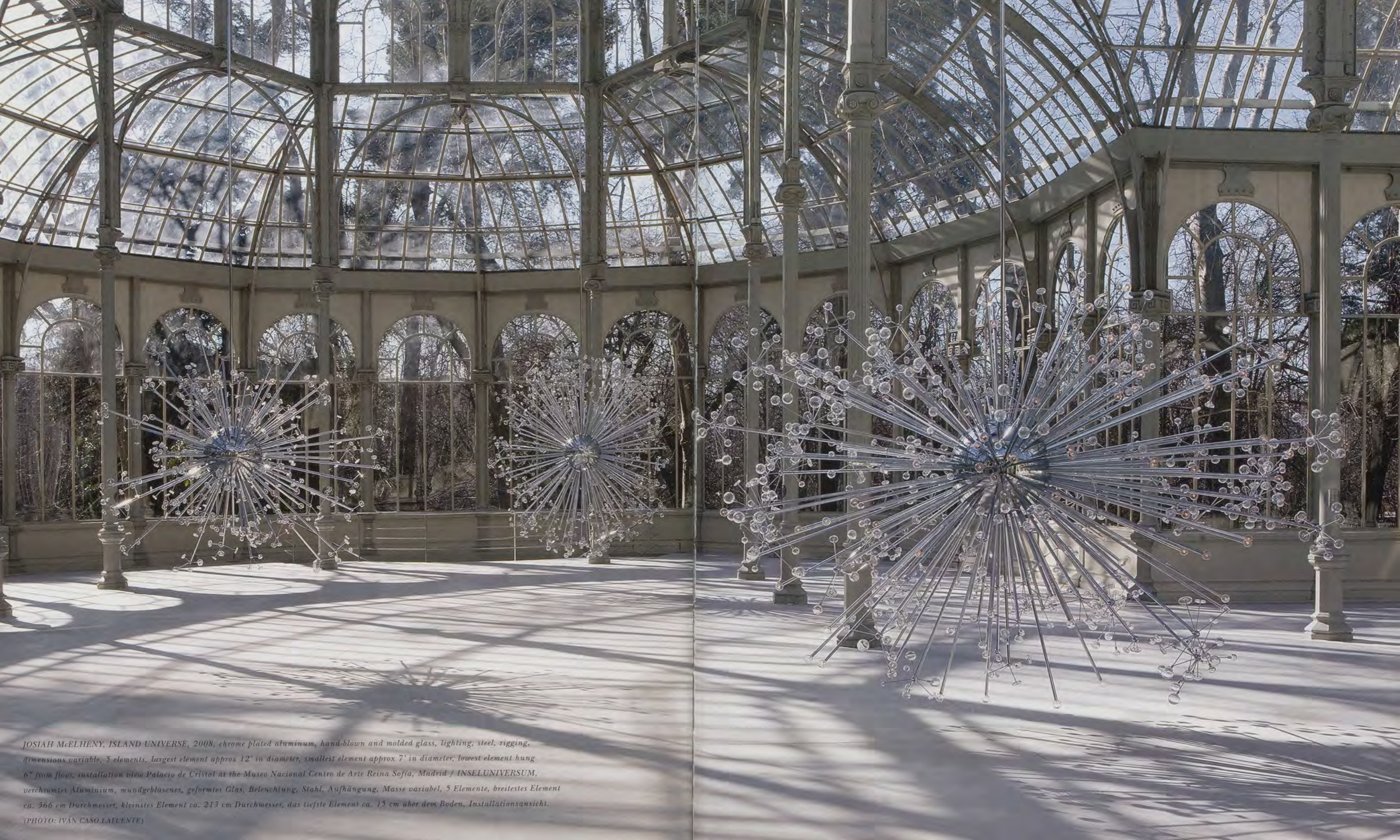
JOSIAH McELHENY, ISLAND UNIVERSE, 2008, chrome plated aluminum, hand-blown and molded glass, lighting, steel, rigging, dimensions variable, 5 elements, largest element approx 12' in diameter, smallest element approx 7' in diameter, lowest element hung 6" from floor, installation view Palacio de Cristal at the Museo Nacional Centro de Arte Reina Sofía, Madrid / INSELUNIVERSUM, verchromtes Aluminium, mundgeblasenes, geformtes Glas, Beleuchtung, Stahl, Aufhängung, Masse variabel, 5 Elemente, breitestes Element ca. 366 cm Durchmesser, kleinstes Element ca. 213 cm Durchmesser, das tiefste Element ca. 15 cm über dem Boden, Installationsansicht.