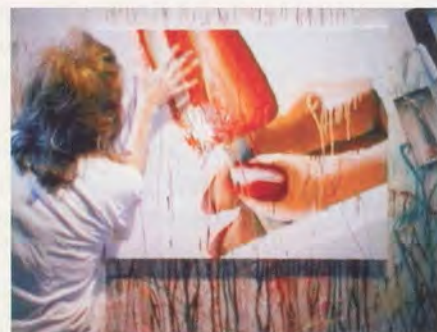
MARILYN MINTER, 100 FOOD PORN, 1990, video stills / Videostills.