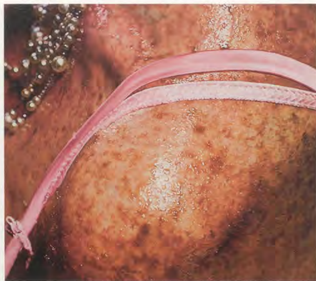
MARILYN MINTER, FRECKLES, 2006, enamel on metal, 60 x 86" / SOMMERSPROSSEN, Lack auf Metall, 152,5 x 218,5 cm.

Als die junge Künstlerin die Ausbeute ihren Mitstudenten zeigte, war deren negative Reaktion derart heftig, dass sie 26 Jahre lang keine Abzüge mehr machte und sie nicht mehr