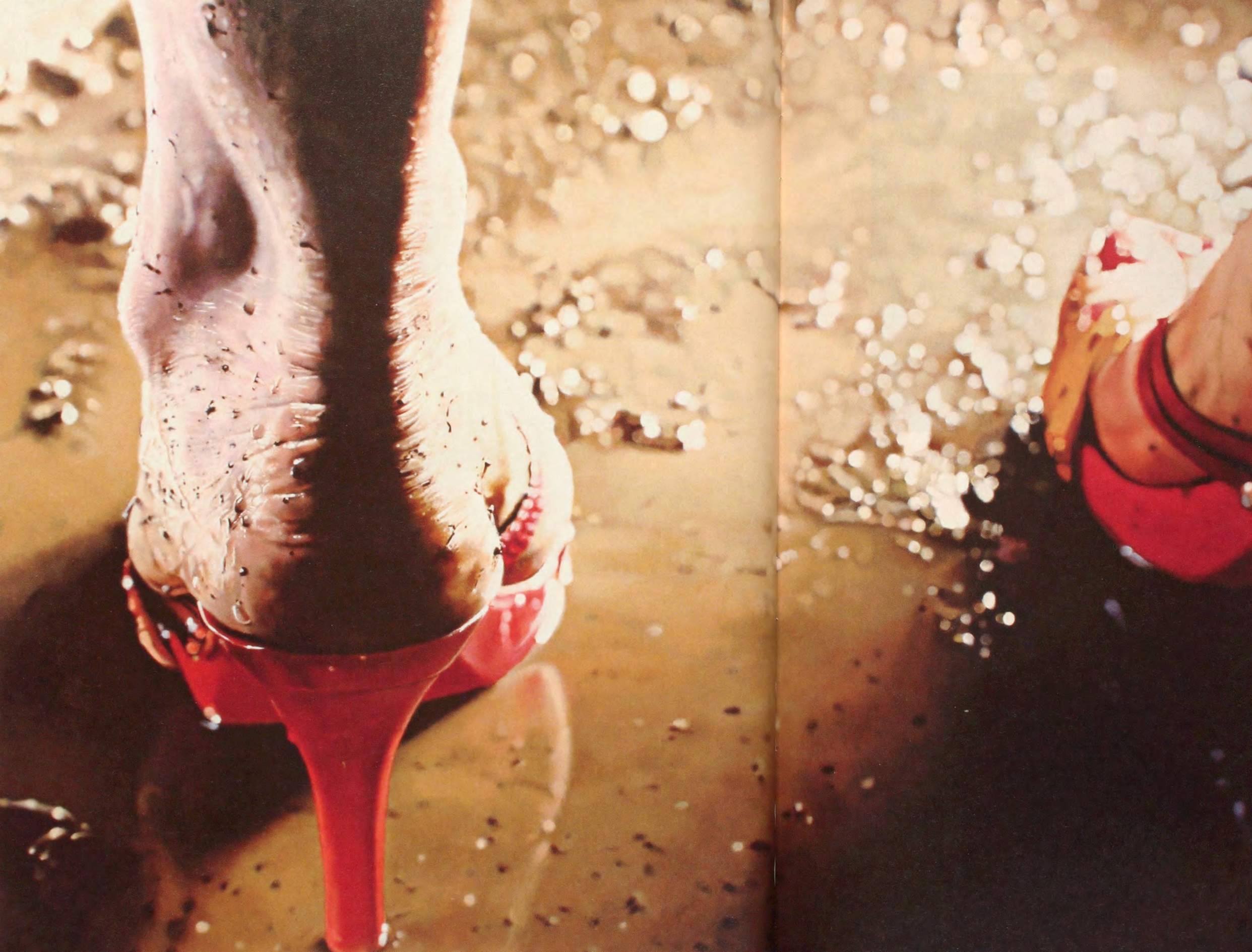
MARILYN MINTER, RUBY SLIPPERS, 2006, enamel on metal, 36 x 48" / Lack auf Metall, 91,5 x 122 cm.