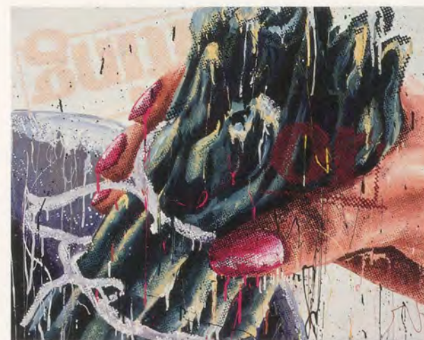
MARILYN MINTER, 100 FOOD PORN, enamel on metal, 24 x 30" / Lack auf Metall, 61 x 76 cm.