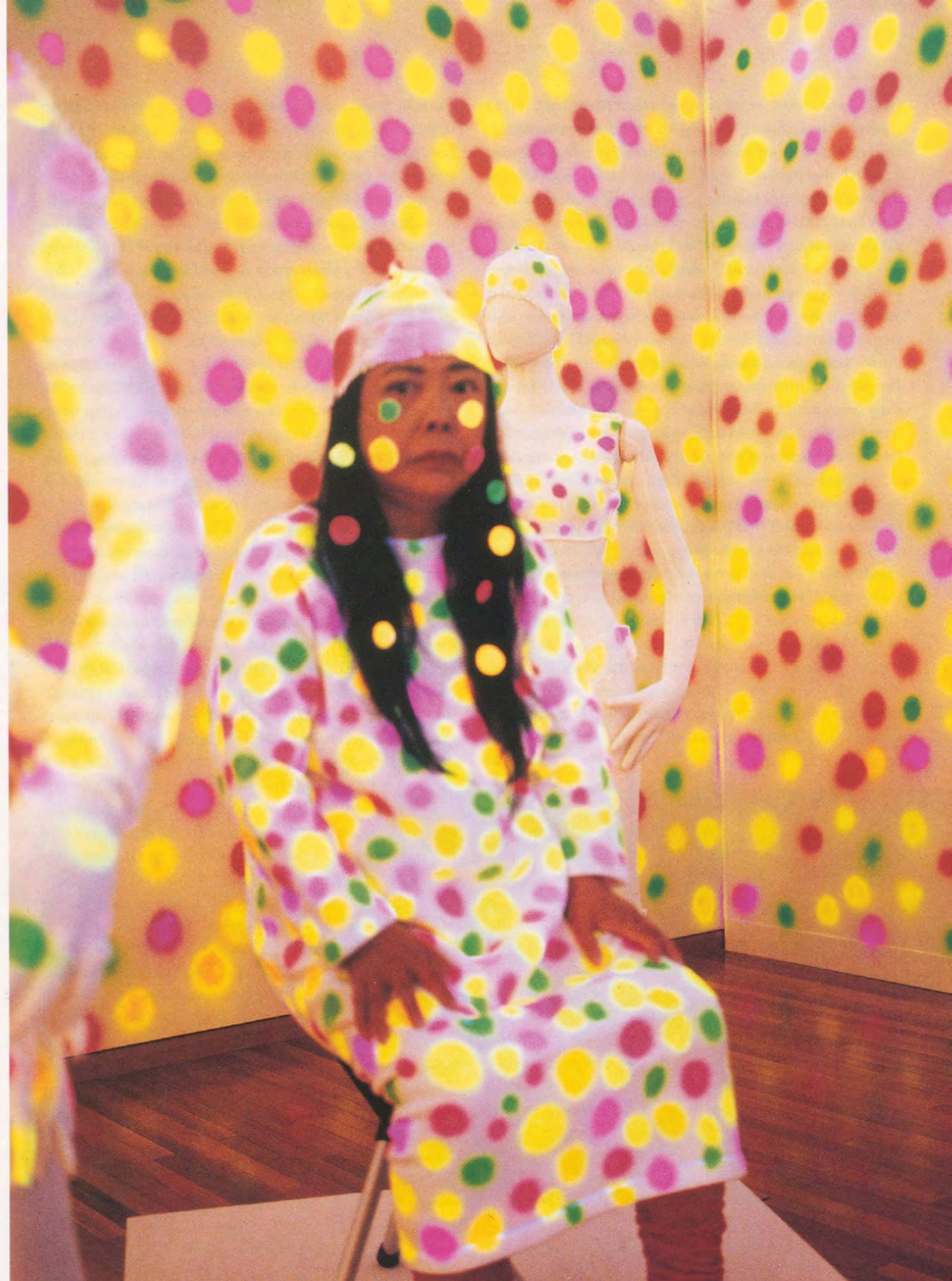
YAYOI KUSAMA, POLKA DOT INSTALLATION AND PERFORMANCE, 1999, collaboration with Issay Miyake, Museum of Contemporary Art, Tokyo.

Gilles Deleuze and Felix Guattari's theory of "schizophrenia" is useful as a means to unfold Kusama's productivity. As provocatively defined in Anti-Oedipus (1972), "schizophrenia" indicates a liberating counter-movement within capitalist culture that resists its functional institutions, or "desiring machines," which turn people into cogs of the repressive social organization. 2 "Schizophrenia" sets