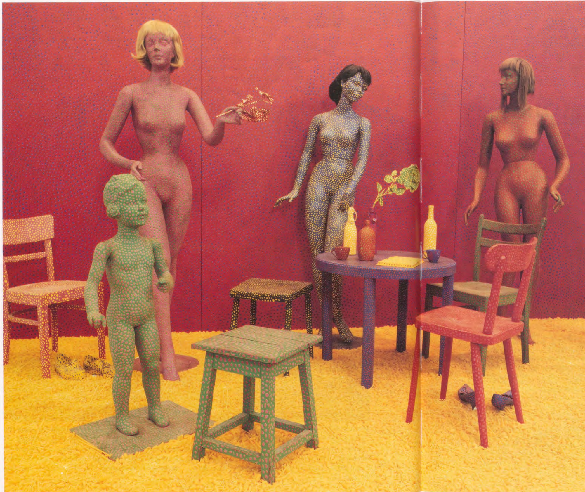
YAYOI KUSAMA, DRIVING IMAGE , 1959–64, installation view, Serpentine Gallery, London, 2000 / REIZTREIBENDES BILD.

gen oder Ordnungsmustern aus, meint Guattari, sondern zerstöre gerade Materialien, Formen, Farben und Bedeutungen, um grössere kreative Freiheit zu erlangen; in ihren undifferenzierten und modulierenden Wucherungen funktioniere sie wie «ein chemischer Prozess». Kusama setze ihre Betrachter «hochkomplexen und differenzierten Vorgängen» aus, die wiederum «hyperkomplexe Emotionen» hervorriefen. Gleichwohl weist Guattari darauf hin, dass die von Kusama geschaffenen «aussergewöhnlichen Maschinen, die zutiefst zeitgenössische Stoffe subjektiv und ästhetisch intensivieren», dieselben sind, «mithilfe derer die Konsumgesellschaft ihre ebenso erbärmliche wie entzauberte Welt verschleiert». Diese Bemerkung scheint den revolutionären Optimismus der These aus dem Anti-Ödipus einzuschränken, «dass der Kapitalismus im Zuge seines Produktionsprozesses eine ungeheure schizophrene Ladung erzeugt, auf der wohl seine Repression lastet, die sich aber unaufhörlich als Grenze des Prozesses reproduziert». 15)