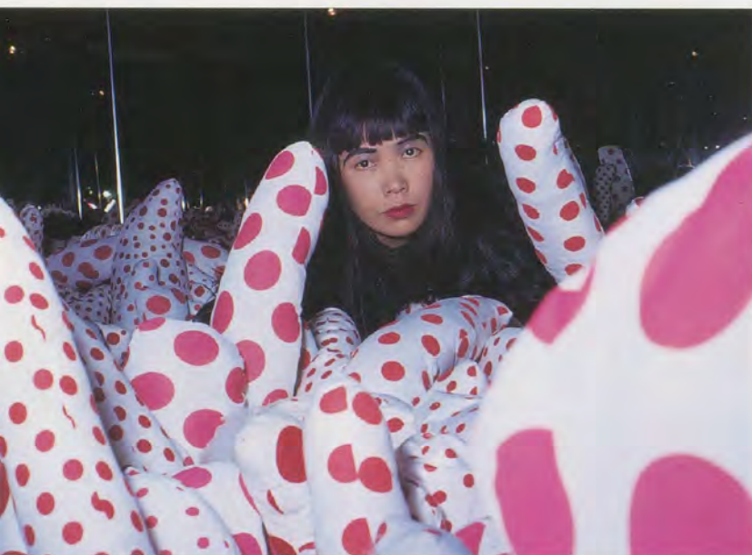
YAYOI KUSAMA, PHALLI'S FIELD, 1964, floor show at Castellane Gallery, New York / PHALLENFELD.

protean transformation of the “polka dot” pattern into the accumulation of banal found objects (air-mail stickers, working gloves, sofa springs) and stuffed protruding sculptural units, and maintains stylistic independence from major artistic schools of her time—Abstract Expressionism, Pop, Minimalism, Nouvelle Tendance—while indicating some overlap with their experimental characteristics. More fundamentally, it is Kusama’s ability to transmit the intense pain and joy of creation whose relentless process demands her to undergo a state of death in life—“self-obliteration”—in her individual works that confirms her place in Deleuze and Guattari’s cosmology. 9) The artist who emerges as a sum of such creative invocations is not the Oedipal daughter sublimating her psychiatric scars through art, but the bold agent of a radical aesthetic.