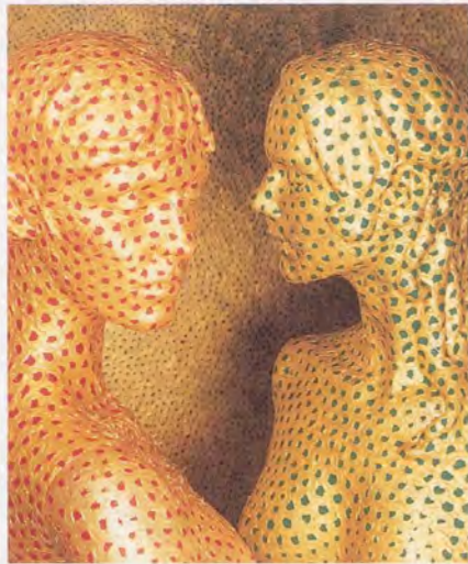
YAYOI KUSAMA, BEYOND MY ILLUSION, 1999, detail, mixed media installation, dimensions variable / JENSEITS MEINER ILLUSION.

Muster zustande kommt. Dennoch präsentiert Kusama unbestreitbar eine exemplarische «schizophrene» Wunschproduktion, die den Funktionen repressiver Gesellschaftsmechanismen zuwiderläuft. Vor allem aber verkörpert ihre Kunst den Schmerz der postmodernen Spaltung und zeigt zugleich eine Möglichkeit auf, deren materielle Fixierung aufzulösen: Damit liefert die Künstlerin ihrem Publikum, das in künstlichen Sinnesreizen die flüchtige Bestätigung des Lebens sucht, ein Modell, das uns die tiefe Ambivalenz von Kunst und Leben begreifbar macht.