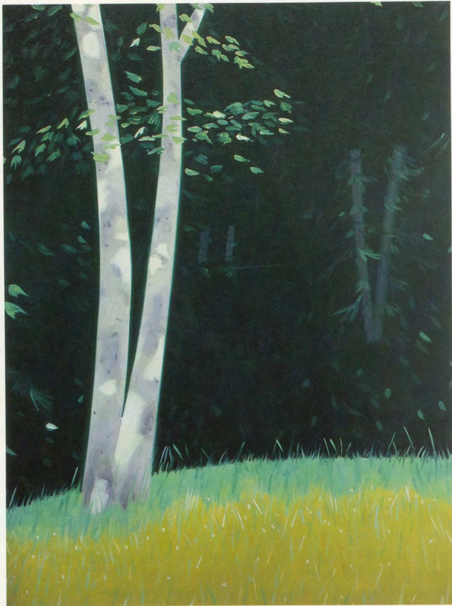
ALEX KATZ, CLEARING / LICHTUNG , 1986, OIL ON CANVAS / ÖL AUF LEINWAND, 96 x 72 " / 244 x 183 cm.