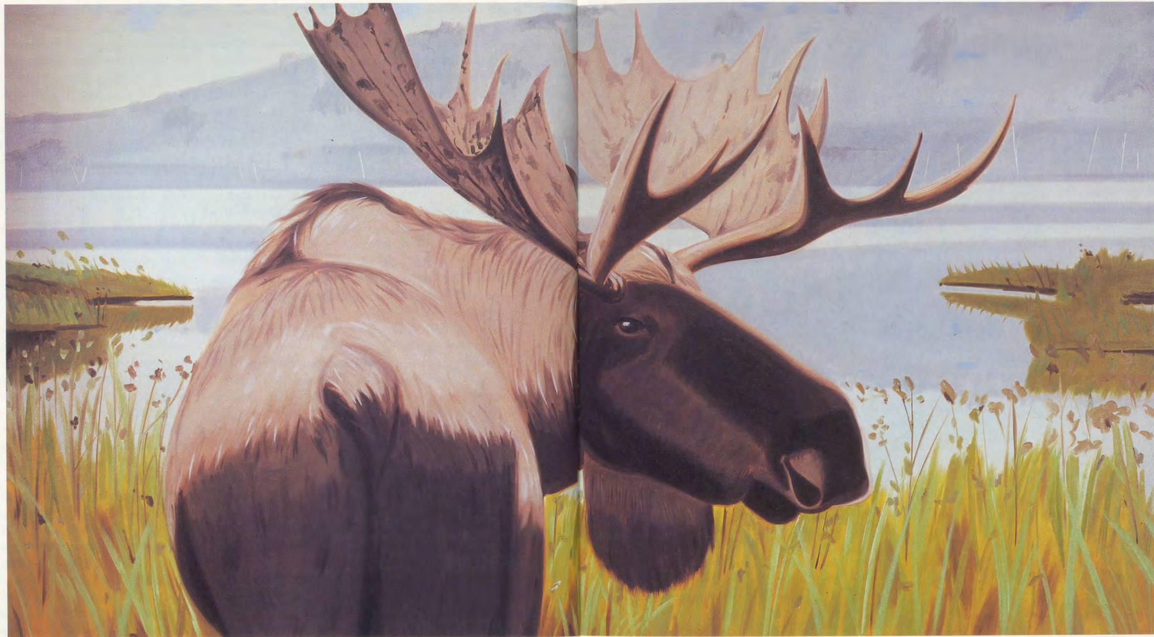
ALEX KATZ, MOOSE HORN STATE PARK, 1975. OIL ON CANVAS / ÖL AUF LEINWAND, 6 x 12' / 188 x 366 cm.

die beiden haben in der Graphik die europäische Tradition herausgefordert – Warhol, indem er sie gewissermaßen flächiger, und Johns, indem er sie malerischer gestaltete. Es war in den 60er Jahren eine aufregende Atmosphäre für den Umgang mit Drucken.»