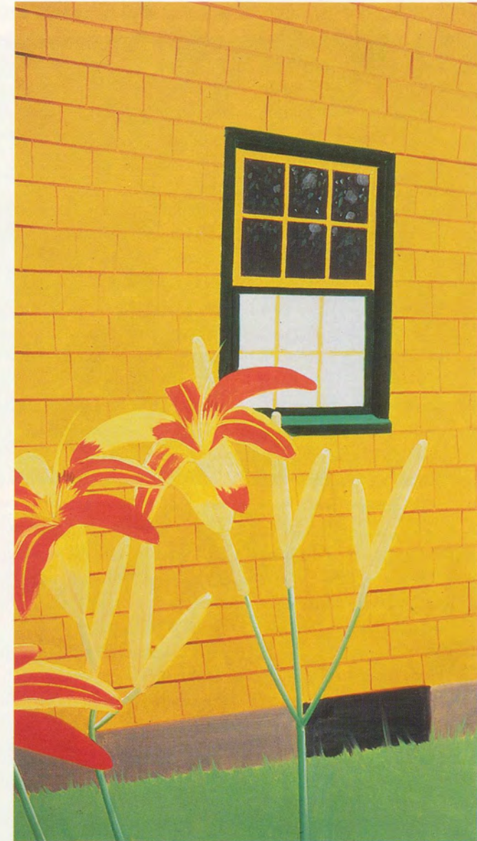
ALEX KATZ, LILIES AGAINST THE YELLOW HOUSE / LILIEN VOR GELBEM HAUS , 1983 OIL ON CANVAS / ÖL AUF LEINWAND, 84 x 48 " / 213 x 122 cm.