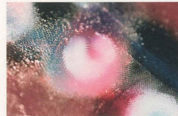
MARILYN MINTER, fingerprints / Fingerabdrücke, detail.

CR: Glaubst du, die Tatsache, dass Hainley diese Bilder erneut publik machte, hat dich dazu gebracht, die Photo-