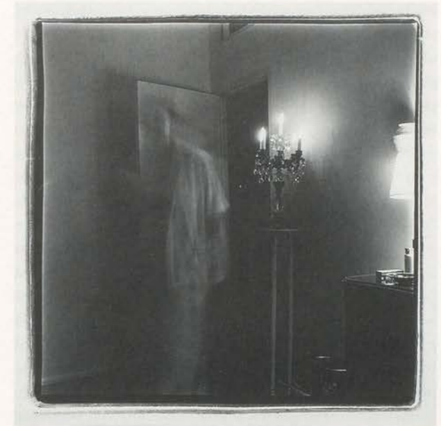
MARILYN MINTER, MOM IN NEGLIGEE / MOM MAKING UP / UNTITLED / MOM SMOKING / MOM DYEING EYEBROWS, Coral Ridge Towers series, 1969–1995, black-and-white photographs, 30 x 40" / MUTTER IM NEGLIGÉ / MUTTER SICH SCHMINKEND / OHNE TITEL / MUTTER RAUCHEND / MUTTER AUGENBRAUEN FÄRBEND, Schwarz-Weiss-Photographien, je 76 x 101,5 cm.