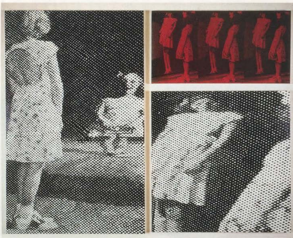
MARILYN MINTER, LITTLE GIRLS # 1 , 1986, enamel on canvas, 3 panels, 68 x 86" / KLEINE MÄDCHEN, Lack auf Leinwand, 3 Tafeln, 172,7 x 218,5 cm.

I've been making the same image all my life. But what you just said, I think about a lot. People are so surprised by the photographs of my mother because they are not used to seeing pictures of high-end addiction. They're more used to seeing somebody crippled by addiction, lying in the street with needles hanging out of their arms. Larry Clark or Jim Goldberg are really sensational but both create an image of addiction that is recognizable to a lot of people.