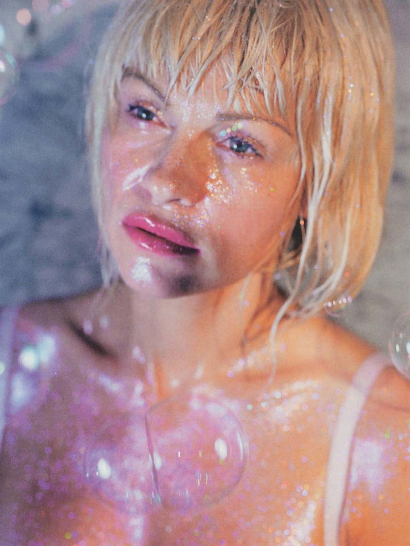
MARILYN MINTER, DOUBLE BUBBLE, 2007, C-print, 50 x 36" / DOPPEL-SEIFENBLASE, C-Print, 127 x 91,5 cm.