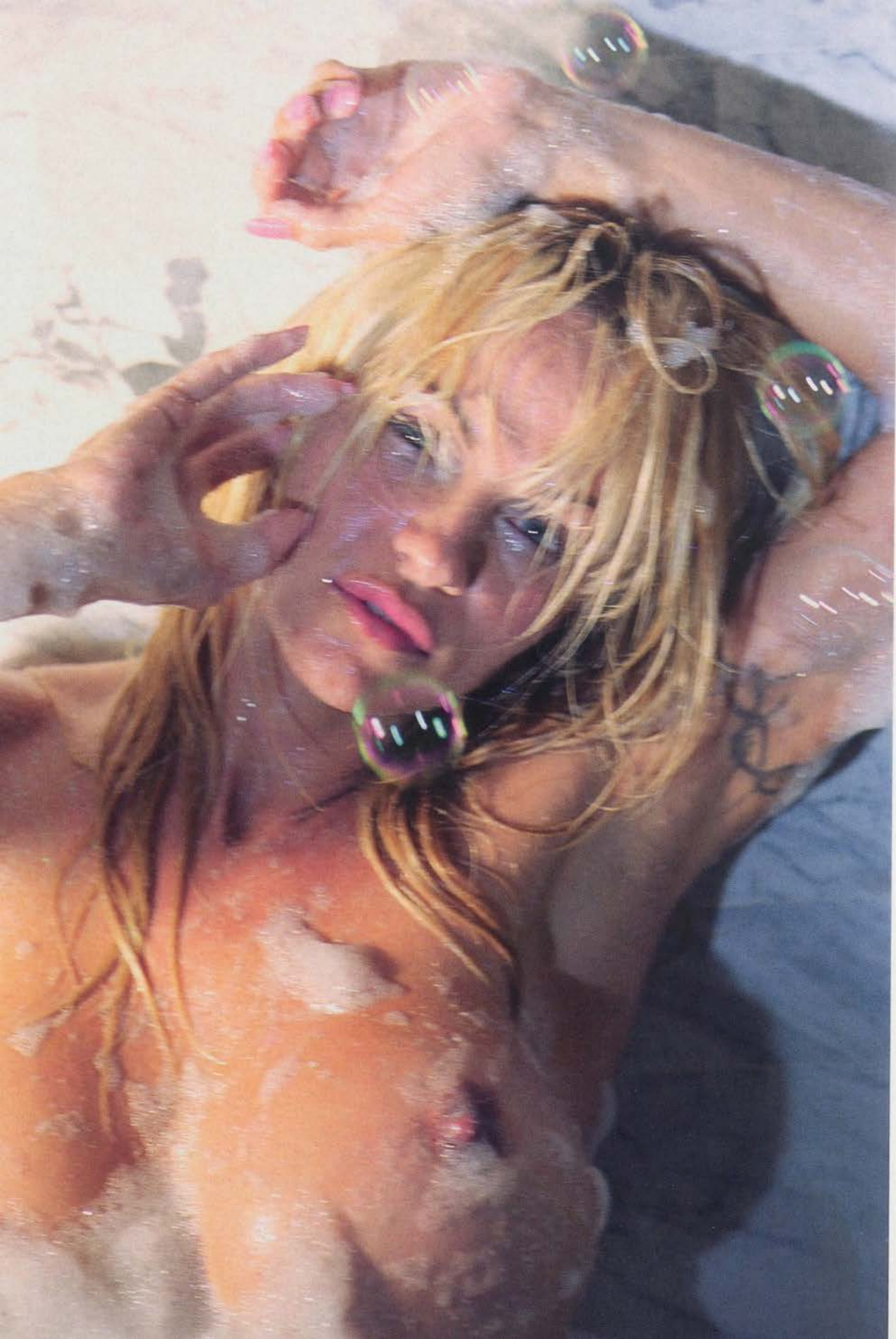
MARILYN MINTER, CENTERFOLD # 2, 2007.