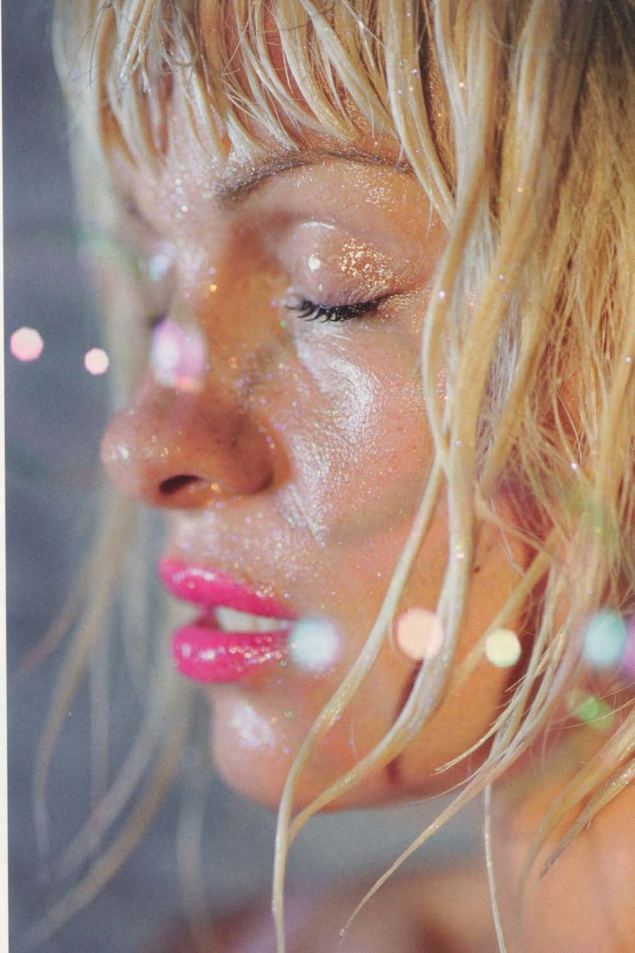
MARILYN MINTER, JOJOS MOM, 2007, C-print, 50 x 36" / JOJOS MUTTER, C-Print, 127 x 91,5 cm.