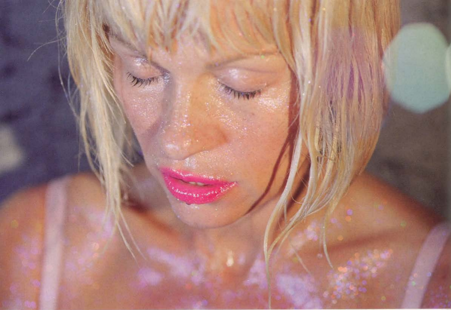
MARILYN MINTER, TWO GREEN FLARES, 2007, C-print, 50 x 36" / ZWEI GRÜNE REFLEXE, C-Print, 127 x 91,5 cm.