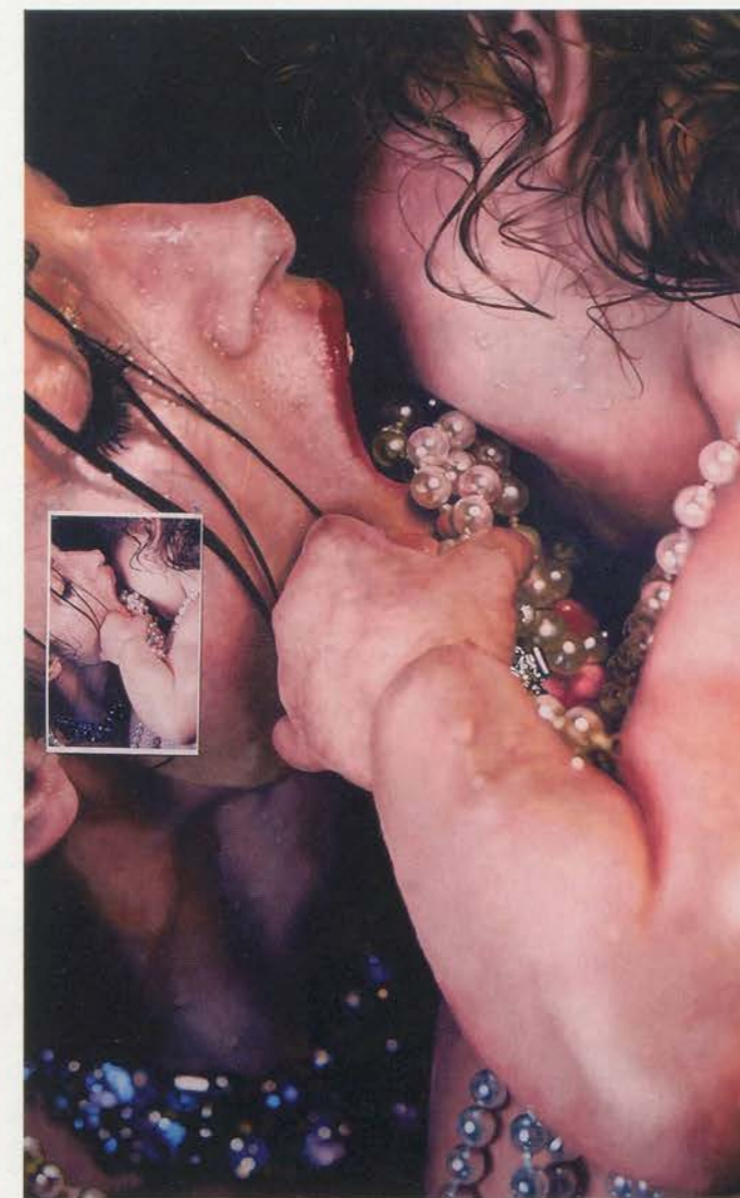
MARILYN MINTER, IT'S MINE (work in progress), 2007, enamel on metal, 52 1/2 x 84" /

CR: But only people who really like music can listen to music like that.