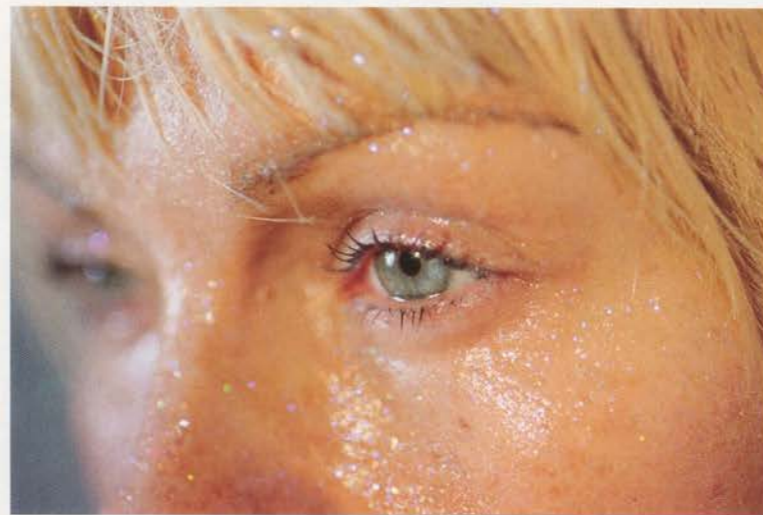
MARILYN MINTER, COOL BLUE, 2007.