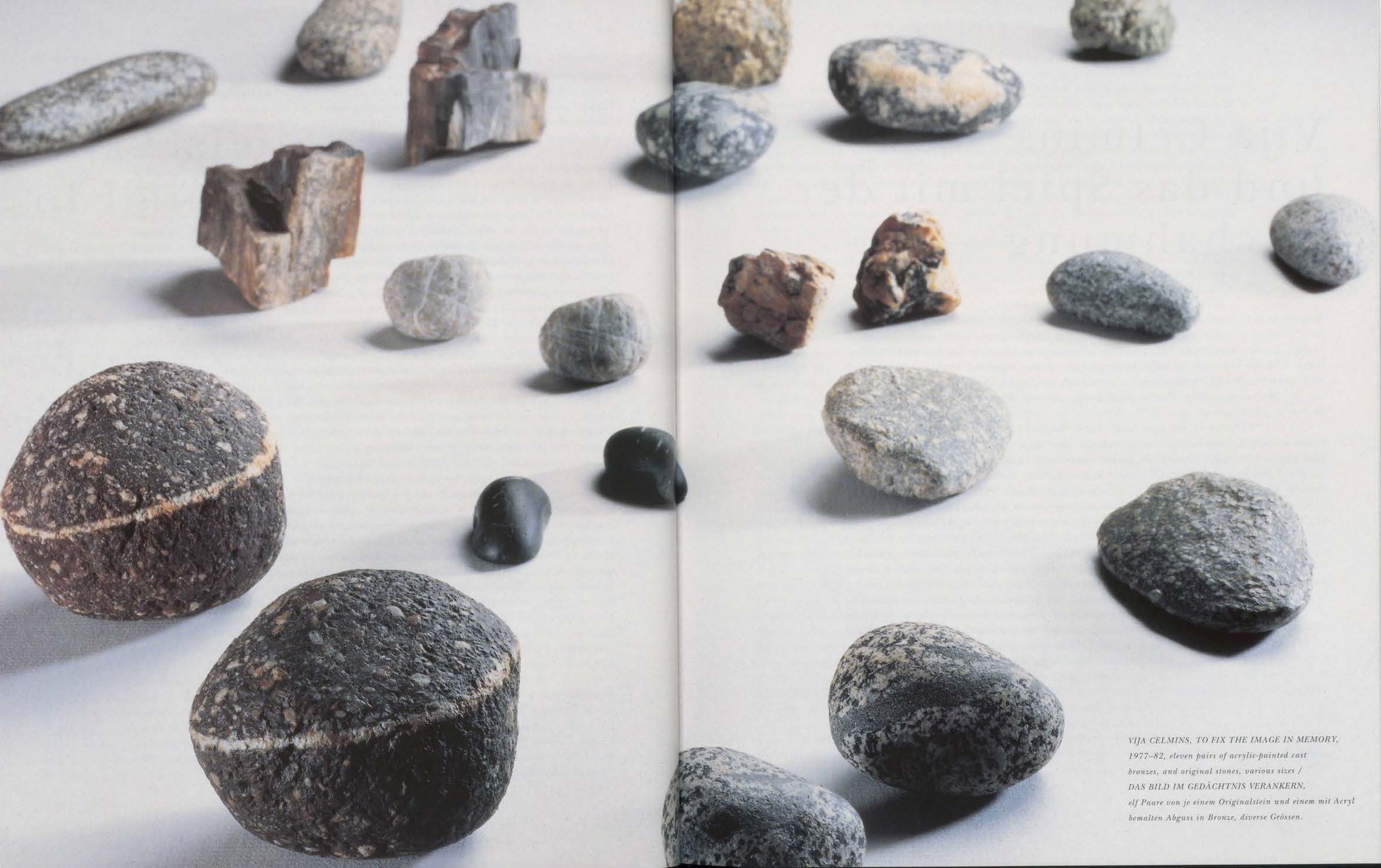
VIJA CELMINS, TO FIX THE IMAGE IN MEMORY, 1977-82, eleven pairs of acrylic-painted cast bronzes, and original stones, various sizes / DAS BILD IM GEDÄCHTNIS VERANKERN, elf Paare von je einem Originalstein und einem mit Acryl bemalten Abguss in Bronze, diverse Grössen.