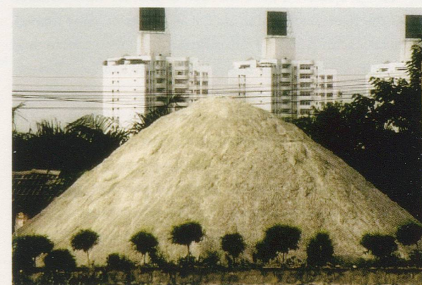
ALLORA & CALZADILLA, AMBHIBIOUS (LOGIN-LOGOUT) , 2005, 1-channel video with sound, 6’22” / AMPHIBISCH (LOGIN-LOGOUT) , 1-Kanal-Video mit Ton.