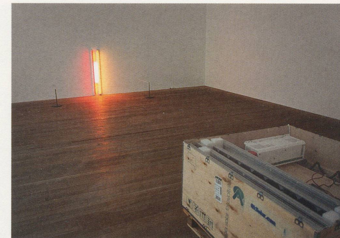
DAN FLAVIN, PUERTO RICAN LIGHT (TO JEANNIE BLAKE), 1965, and ALLORA & CALZADILLA, PUERTO RICAN LIGHT, 1998–2003, battery bank containing solar panels, batteries, inverter / PUERTORIKANISCHES LICHT, Batterie mit Solarzellen, Batterien, Inverter.

JA: Yes. This is a perfect case in which the physical properties of a sculptural material—mud—are constitutively marked by history and culture. Not in the sense of a grand artistic tradition, such as granite or bronze, but rather in the sense of the waste products and detritus of a city that have accumulated over hundreds of years as sediment at the bottom of the Venice canal. We literally delved into the dregs of history in order to conjure up the hippopotamus (Latin < river horse) as a kind of monstrous, counter-memorial figure to the triumphalist equestrian monuments that populate the public spaces of the city. And, yes, one point of reference was indeed Kounellis' 12 CAVALLI (1969).