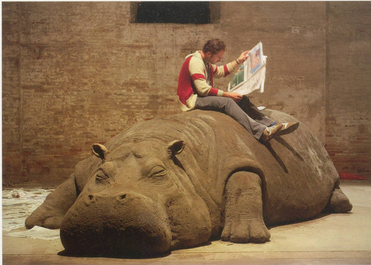
ALLORA & CALZADILLA, HOPE HIPPO, 2005, mud, whistle, daily newspaper, live person, 16 x 6 x 5' / NILPFERD HOFFNUNG, Schlamm, Pfeife, Tageszeitung, Leser, 490 x 183 x 152 cm.

Asien und Lateinamerika (die sich im Lauf der letzten drei Jahrhunderte über die kolonialen Netzwerke der wissenschaftlichen Forschung und der kapitalistischen Agrarindustrie auf dem gesamten Globus verbreitet haben); sie wurden zu einer Art hybridem Monsterorganismus zusammengepfropft, dessen Lebensfähigkeit ungewiss ist.