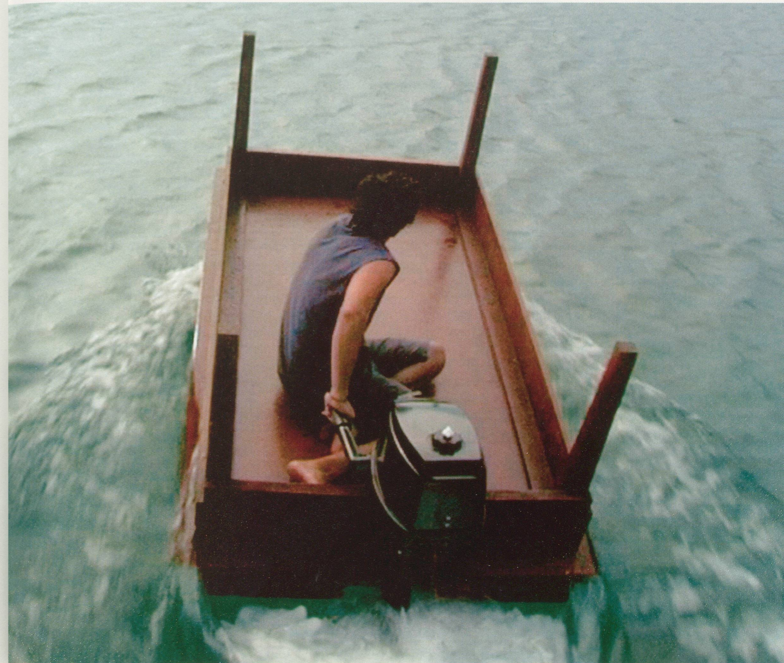
ALLORA & CALZADILLA, UNDER DISCUSSION, 2005, 1-channel video with sound, 6'14" / ZUR DISKUSSION STEHEND, 1-Kanal-Video mit Ton.

1) Benjamin Buchloh, «Beuys: The Twilight of the Idol», Artforum International (Januar 1980), S. 35–43.